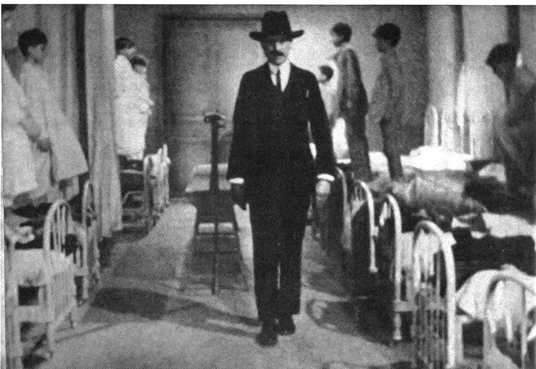
Jugendliche Phantasie und Anarchie gegen patriarchalische Autorität und Repression: Jean Vigos «Zéro de conduite». – Bild rechts: Jean Vigo auf dem Weg zum «poetischen Realismus»: «L'Atalante» (mit Michel Simon als Père Jules).

Das Gas ist es, das die Explosion auf der französischen Seite der Grube auslöst, eine Explosion, der Brände folgen, die viele Menschen verschüttet oder zumindest in den Stollen