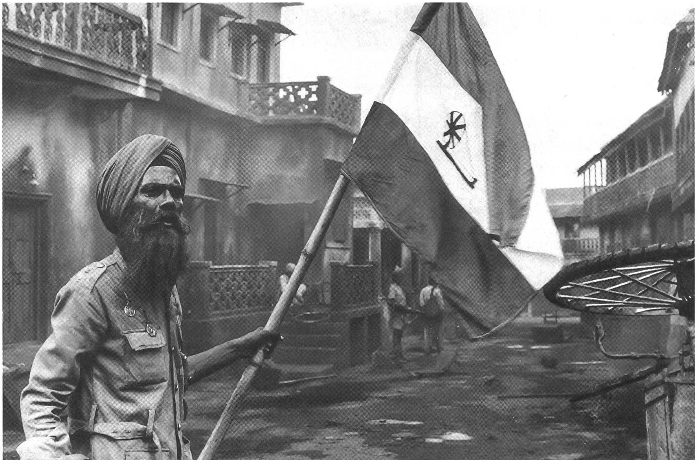
Kritische Bewältigung einer schwierigen Vergangenheit: «Tamas» (Finsternis) von Govind Nihalani.

Sagar und «Mahabharat» von B. R. Chopra – beide beruhen auf indischen Nationalepen mit religiös-hinduistischem Hintergrund – wurden zu eigentlichen Strassenfegern. Bis zu 50 Millionen Haushalte soll die 78teilige Serie «Ramayan» jeweils erreicht haben, und als sie nach fast 18 Monaten Laufzeit mit der Krönung von Lord Rama ein (vorläufiges) Ende fand, fühlten, laut «Hindustan Times», viele Inder ein Gefühl der Leere.