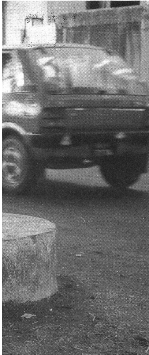
Prozess einer langsamen Selbstfindung und Emanzipation: «Main Zinda Hoon» von Sudhir Mishra.

ben, ihre arbeitenden Landsleute noch schlechter behandeln als ihre Vorgänger, ist die delikate, aber durch viele Beispiele belegte Aussage dieses Werkes, das im übrigen historisch genau und auf reale Fakten zurückgreifend die Entstehung gewerkschaftlicher Aktivitäten der Arbeiter auf den Gummipflanzungen Keralas beschreibt. Zwar vermag der mit viel freiwillig geleisteter Arbeit zustandegewordene Film in seiner konventionellen Machart wegen formal nicht restlos zu überzeugen, doch wird dies durch das politische und soziale Engagement mehr als nur wettgemacht.