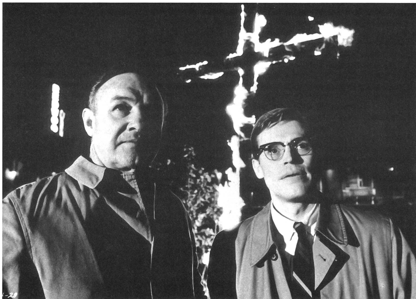
Gene Hackman (links) und Willem Dafoe als FBI-Agenten in «Mississippi Burning».

verabschiedet, die Rassendiskriminierung im Dienstleistungssektor und bei Bundessubventionen verbietet. Überdies wird eine Bundeskommission geschaffen, die fortan berufliche Chancengleichheit gewährleisten soll. Zwei Tage nach diesem historischen Akt werden in Philadelphia (Mississippi) drei junge Bürgerrechtler, ein Schwarzer und zwei Weiße, wegen Geschwindigkeitsüberschreitung vorübergehend festgenommen. Nach ihrer Entlassung in der gleichen Nacht werden sie vermisst gemeldet. Das Federal Bureau of Investigation (FBI) wird auf den Fall angesetzt, der mit der Bezeichnung «Mississippi Burning» kodiert wird.