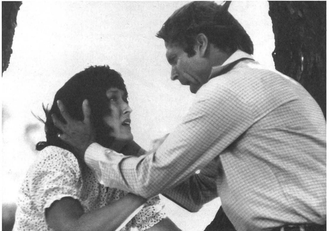
Meryl Streep und Sam Neill als Ehepaar Chamberlain, das in die Fänge der Medien und in die Mühlen der Justiz gerät.

tung der Fakten in Schein transformiert, der in der Folge Eigenleben und Eigendynamik gewinnt. Im Moment, wo die Chamberlains realisieren, dass sie im Schaufenster der Medien ein unvoreilhaftes Bild bieten, ist es bereits zu spät; all ihre Versuche, das Image zu korrigieren, zementieren noch die bereits festgefahrenen Urteile.