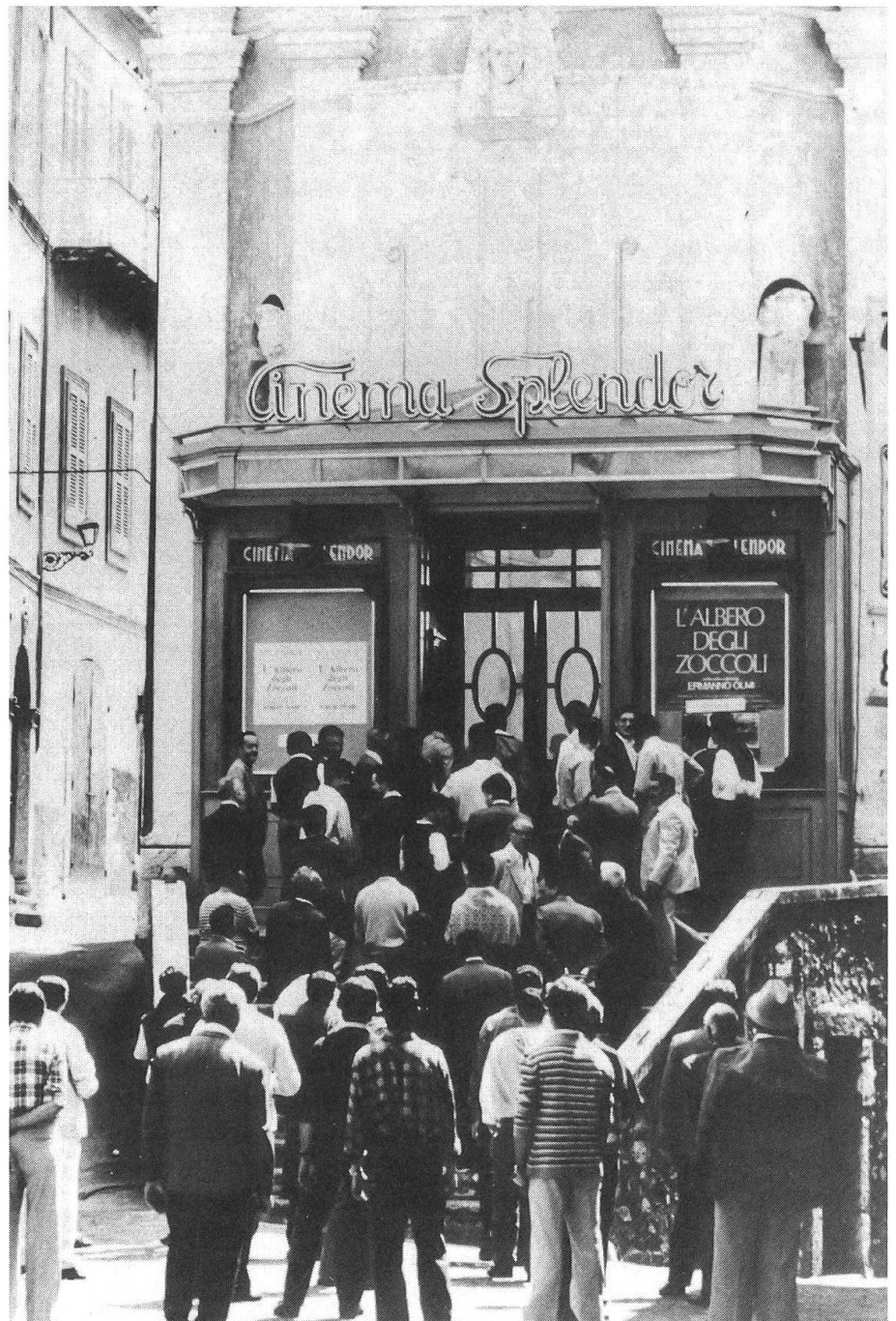
Abgesang auf ein sterbendes italienisches Kino: «Splendor» von Ettore Scola.

Ist das Fernsehen, das pro Tag bis zu neun Filme zeigt, schuld, dass die Kinos leer bleiben? Ist es der internationale