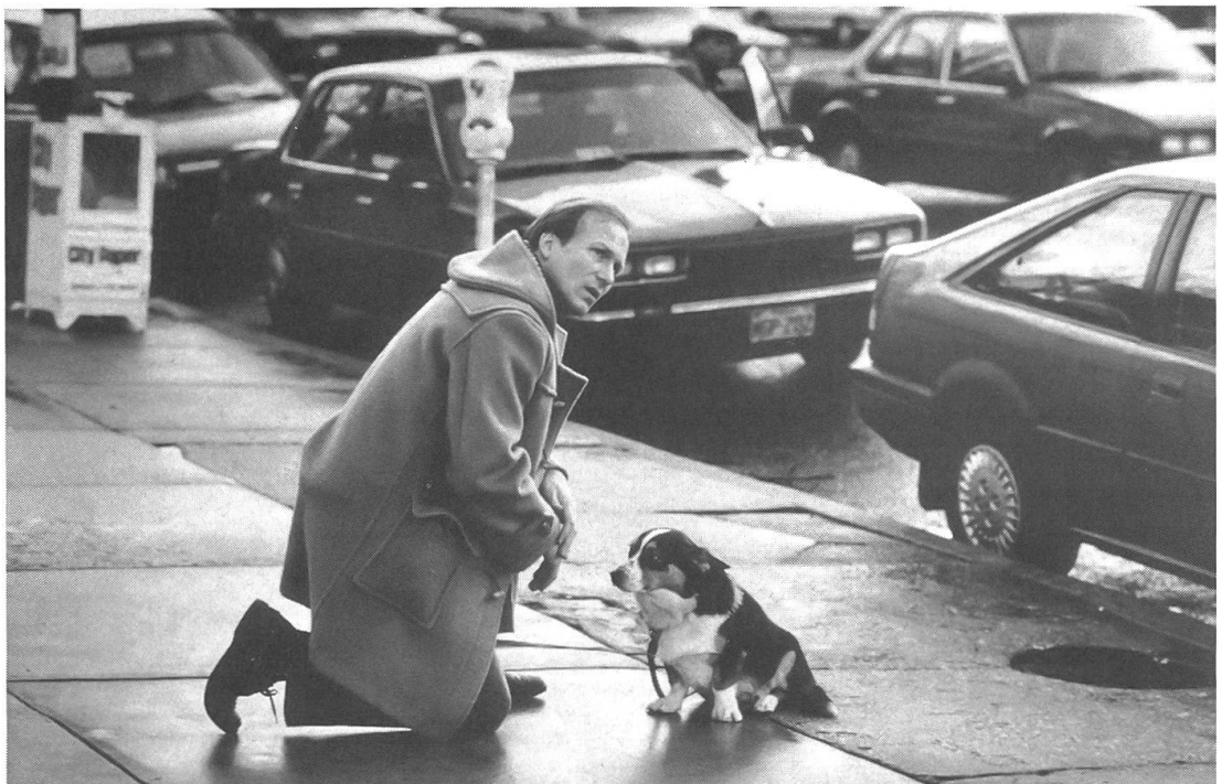
Auf der Reise zum eigenen Ich: William Hurt in Lawrence Kasdans «The Accidental Tourist».

Dergestalt ist, mit einer hehren Freude am verspielten Detail, eine klug ausbalancierte, bezaubernde Mischung von ernsten und komischen Momenten entstanden, die das Leben in all seinen Schattierungen einfängt und dem Zuschauer