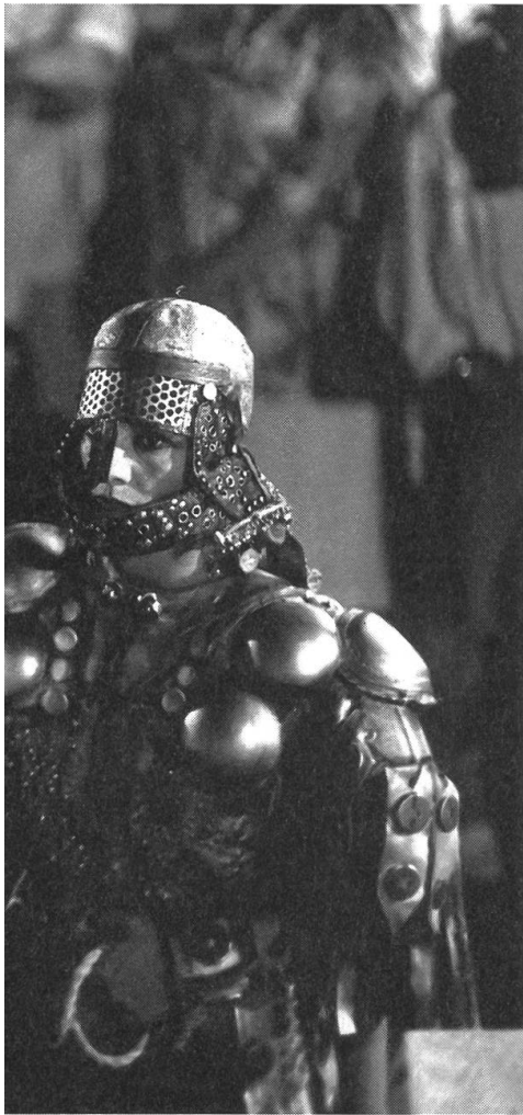
Brillant, kühn und provozierend: «Jésus de Montréal» von Denys Arcand.

sus de Montréal» wirkt Liliana Cavani Film « Francesco », in dem der Amerikaner Mikey Rourke Leben und Wirken des heiligen Franz von Assisi darstellt, auf weite Strecken uninspiriert, bloss bemüht, illustrativ und schön arrangiert zu sein. Erst gegen Ende, in der Darstellung der Einsamkeit und Gottferne Francescos, gewinnt der Film an Intensivität und Kraft. Als ganz ungewöhnliches Werk muss dagegen der Erstlingsfilm « Dharmaga tongjoguro kan kka-dalgun? (Warum ist Bodhi-Dharma Richtung Orient abgereist?) des Südkoreaners Yong-Kyon Bae bezeichnet werden. In einem Kloster in den Bergen