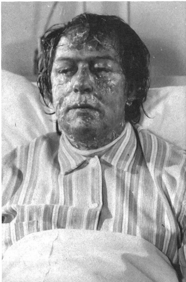
Michael Gambon als kranker Krimi- schriftsteller Philip E. Marlow.

ebenso schmerzlichen Erinnerungen an den einstigen Bruch zwischen Vater und Mutter?