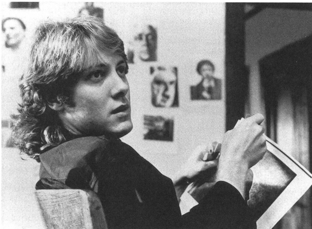
Liebe, Kommunikation und Entfremdung: In diesem Spannungsfeld entwickelt sich die Beziehung zwischen dem «Fremdling» Graham (James Spader, links) und den beiden Schwestern Ann (Andie MacDowell, Bild oben rechts) und Cynthia (Laura San Giacomo).

Videokassetten. Graham (James Spader), ein früherer Schulfreund von John, liebt es, unabhängig und mobil zu bleiben. Daher fährt er im Auto, nur mit einer Videokamera als Gepäck, ziellos durch die Lande. Frauen, denen er unterwegs begegnet, bittet er unter der Zusicherung absoluter Diskretion um ein Interview über ihre sexuellen Erfahrungen. Vor laufender Kamera breiten jene Frauen, die auf Grahams Vorschlag eingehen, ihr ganzes Intimleben aus. Die bespielten Videokassetten sieht sich Graham später alleine an und lässt sich durch die intimen Bekenntnisse erregen.