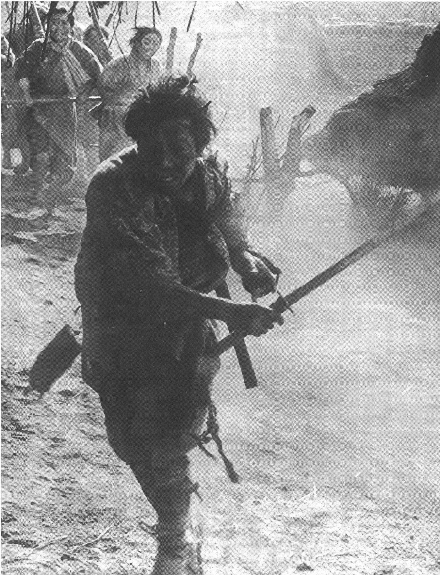
Das Remake und das Original: In «The Magnificent Seven» (Die glorreichen Sieben, links) verlegt John Sturges die Story von «Shichinin no samurai» (Die sieben Samurai) des Japaners Akira Kurosawa in den Wilden Westen.

nung andererseits, dass sich der Erfolg noch einmal wiederholen lasse. Wahrscheinlich sind Remakes eher eine «Erfindung» der Produzenten, also der Geldgeber, als eine der Gestalter, der Realisatoren.