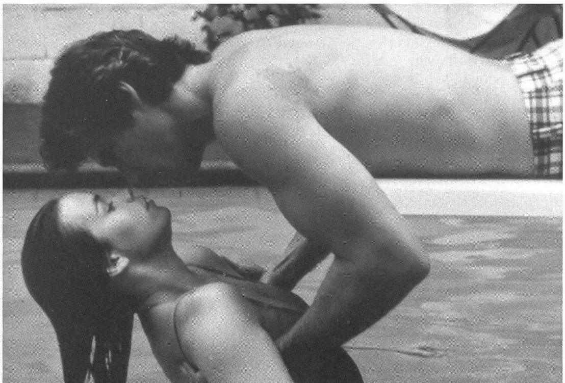
Aus «A bout de souffle» mit Jean Seberg und Jean-Paul Belmondo von Jean-Luc Godard wird «Breathless» mit Valerie Kaprisky und Richard Gere von Jim McBride.

Alfred Hitchcock realisierte zwei verschiedene Versionen von «The Man Who Knew Too Much» (1934 und 1956). Die Gründe, die den Regisseur dazu bewogen haben mögen, seinen eigenen, damals noch in Grossbritannien produzierten Film nach zwanzig Jahren neu und diesmal als Hollywood-Produktion zu drehen, sind mir nicht bekannt. Seinem Interview-Partner François Truffaut gegenüber meinte er bloss: «Sagen wir, die erste Fassung hätte ein talentierter Dilettant gemacht und die zweite ein Professioneller». Es dürfte aber den Virtuosen des Thrillers gereizt haben, noch einmal über die Bücher zu gehen, kleine Schnitzer und Unzulänglichkeiten auszubügeln, neue Motive einzuführen (wie etwa das zum Schlager gewordene, von Doris Day gesungene Lied, das ihrem entführten Sohn signalisiert, wo sie zu finden ist) und zudem das Ganze mit wesentlich mehr Humor auszustatten, wozu ihm die Besetzung der Hauptrolle durch James Stewart sicherlich eine Hilfe war.