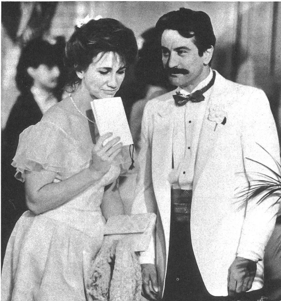
Kathy Baker und Robert De Niro in «Jacknife» von David Jones.

beschaffen sein mag, ein Schauspieler, der zwar ein Star ist, sich dem Mythos des Startums aber verweigert, weil er überzeugt ist, dass man Berühmtheit nur ein bestimmtes Mass lang erträgt, und weil es ihm vor allem wichtig ist, sich als Schauspieler zu entwickeln. Er ist heute unter den Grossen Hollywoods (die immer auch wieder auf der Bühne gegenwärtig sind und von beiden Spielarten des Schauspielertums für ihr Können Nutzen gewinnen) gewiss der einzige nicht, der sich so oder ähnlich verhält. Unter denen jedoch, die fähig sind, sich selber in einer Rolle als Person abzuschreiben, ist er zweifellos je-