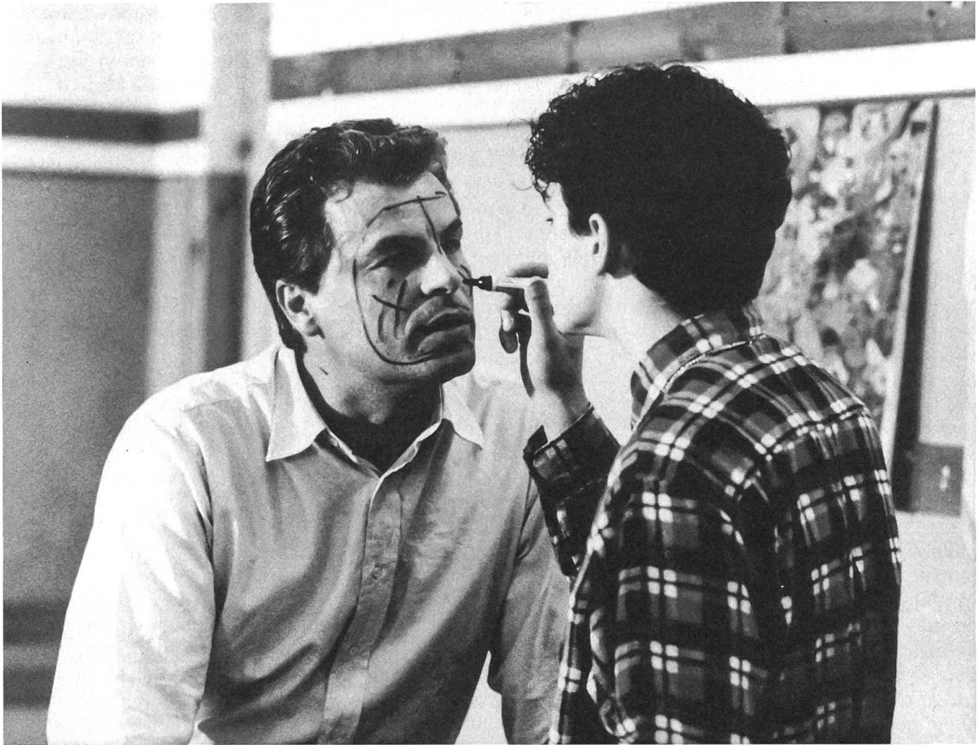
Michele Placido als Lehrer in einer Jugendstrafanstalt in Palermo: aus «Mery per sempre» von Marco Risi.

vom Schicksal auf einige Zeit zusammengeführt.