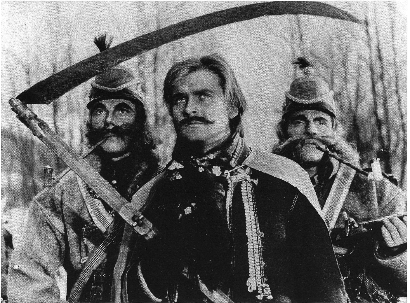
Geschichte einer unmöglichen Liebe zwischen Angehörigen verfeindeter Huzulen-Familien: Romeo und Julia in den Karpaten.

Iwan fällt auf dieselbe Weise wie sein Vater – durch einen Axtschlag. In der Agonie begegnet er Marischka wieder. Mit der Begräbnisfeier, die in eine wilde Tanzszene ausartet, endet der Film.