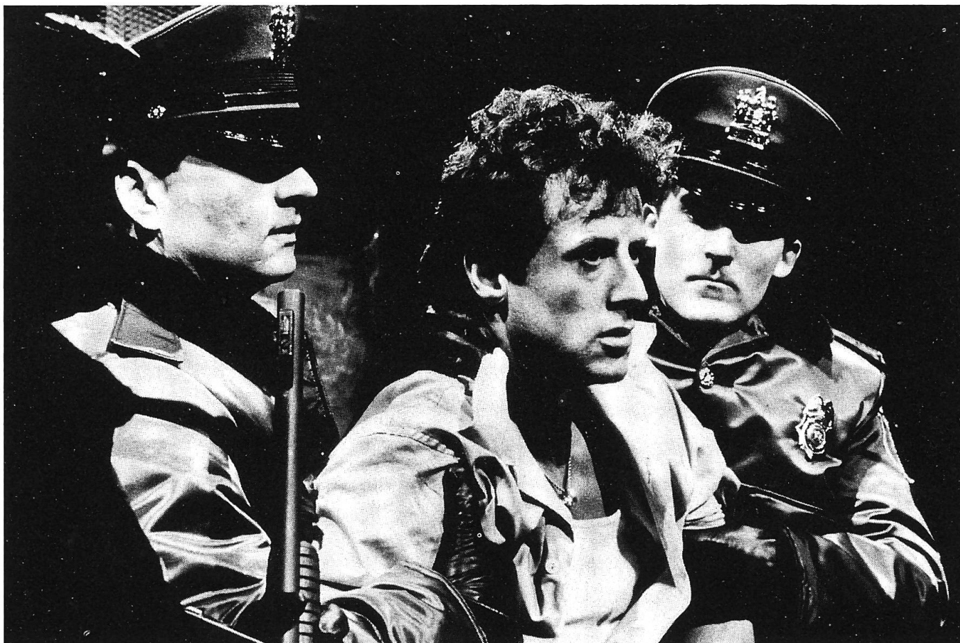
Sylvester Stallone blickt abgeklärt bernhardinerisch aus der dreckigen Wäsche.

die sich ihre Männlichkeit mit der Tortur des physisch überlegenen Häftlings beweisen, aber nur so lange, bis sie es zu weit getrieben haben.