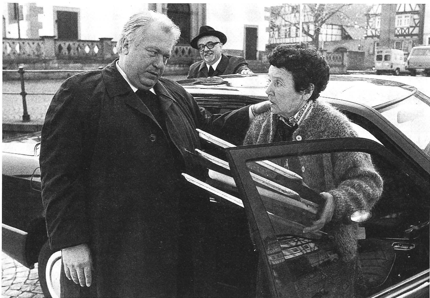
Grosse Nachfrage nach den Bildschirm-Seelsorgern in Serie: Günter Strack alias ZDF-Pfarrer Dr. Dr. Kempfert erreichte höchste Einschaltquoten.

Die Serie als Thema oder als Impuls für die kirchliche Bildungsarbeit: Denkbar ist eine solche Verwendung. Anstatt nun aber einfach einige Folgen anzusehen und kritisch zu durchleuchten, empfiehlt es sich, die Serie als Ganzes zum «Sprungbrett» für individuelle Denkprozesse zu machen. Sobald die Handlung einer Folge auf die Rolle als Initialzündler reduziert wird, kommen die Angesprochenen (es können Teilnehmer einer Gesprächsrunde sein oder Kinder im Religionsunterricht) rasch auf ihre eigene Lebensgeschichte zu sprechen. Die Fragen und Antworten füh-