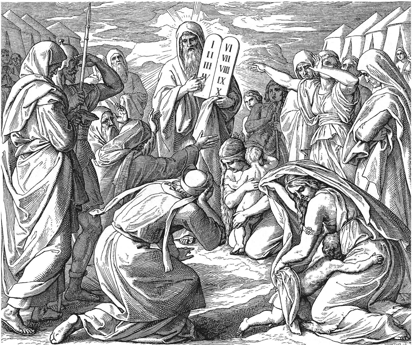
Himmelhohe Ausrufezeichen: Moses bringt dem Volke Israel die neuen Gesetzestafeln. Aus «Die Bibel in Bildern» von Julius Schnorr von Carolsfeld.

sönliche Verantwortung vor Gott. Diesen Prozess kann man ebenso gut als Verinnerlichung sozialer Regelsysteme wie als Ethisierung des Religiösen begreifen.