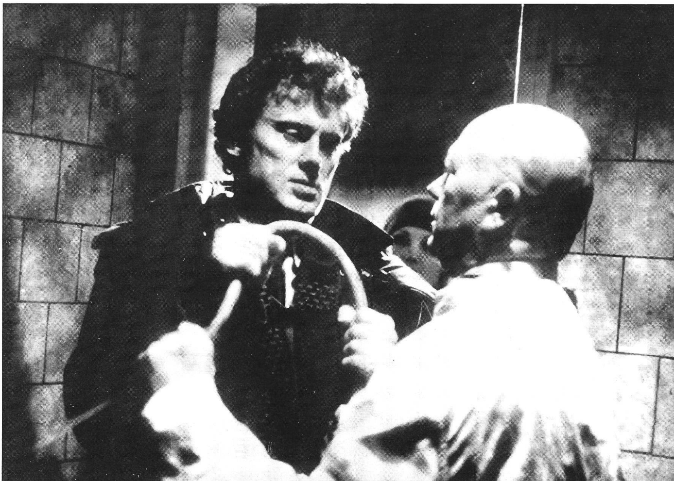
Krystyna Janda und Daniel Olbrychski in «Dekalog, Zwei».