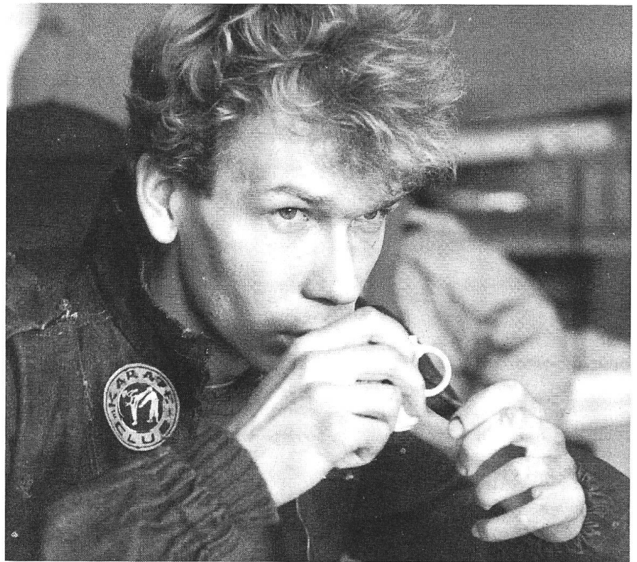
In der (längeren) Kinofassung bereits erfolgreich: «Ein kurzer Film über das Töten» (Dekalog 5) und (Bild rechts) «Ein kurzer Film über die Liebe» (Dekalog 6).

Und wie! Ich drehte die ganze erste Hälfte des Films mit einem