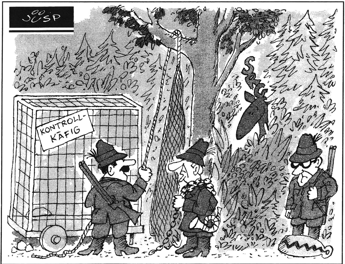
Liberele blasen zur Grosswildjagd (aus: Brückenbauer, Nr. 19, 9. Mai 1990).

in zunehmendem Masse löst und befreit. Besonders augenfällig sind die Prozesse da, wo sie sich (wie im Osten Europas) gegen politische Machtansprüche richten – einer alten, als ungerecht erkannten Ordnung kann dabei nicht auf Antrieb eine bessere und gerechtere Ordnung entgegengesetzt werden. «Pluralismus» meint auch «Zwiepsalt», immer und überall.