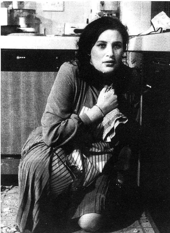
Weder reich noch schön noch berühmt, dafür «teuflisch» konsequent, wenn es darum geht, die heile Welt auf den Kopf zu stellen: Julie T. Wallace als Ruth.

heilen Welt, mit ihrer eigenen Kreation einer heil-losen Welt zu übertrumpfen. Die Widerhaken einer doppeldeutigen Geschichte, die man so nicht einfach zum Nennwert nehmen, sondern auf ihren politischen und philosophischen Hintersinn als «Mehrwert» abklopfen sollte, sie bleiben hier erhalten. Eine gewisse Langatmigkeit, bedingt durch den buchstaben- und schauplatzgetreuen Nachvollzug der einzelnen Stationen dieser (bisweilen so erschreckend alltäglich anmutenden) Höllenfahrt allerdings auch.