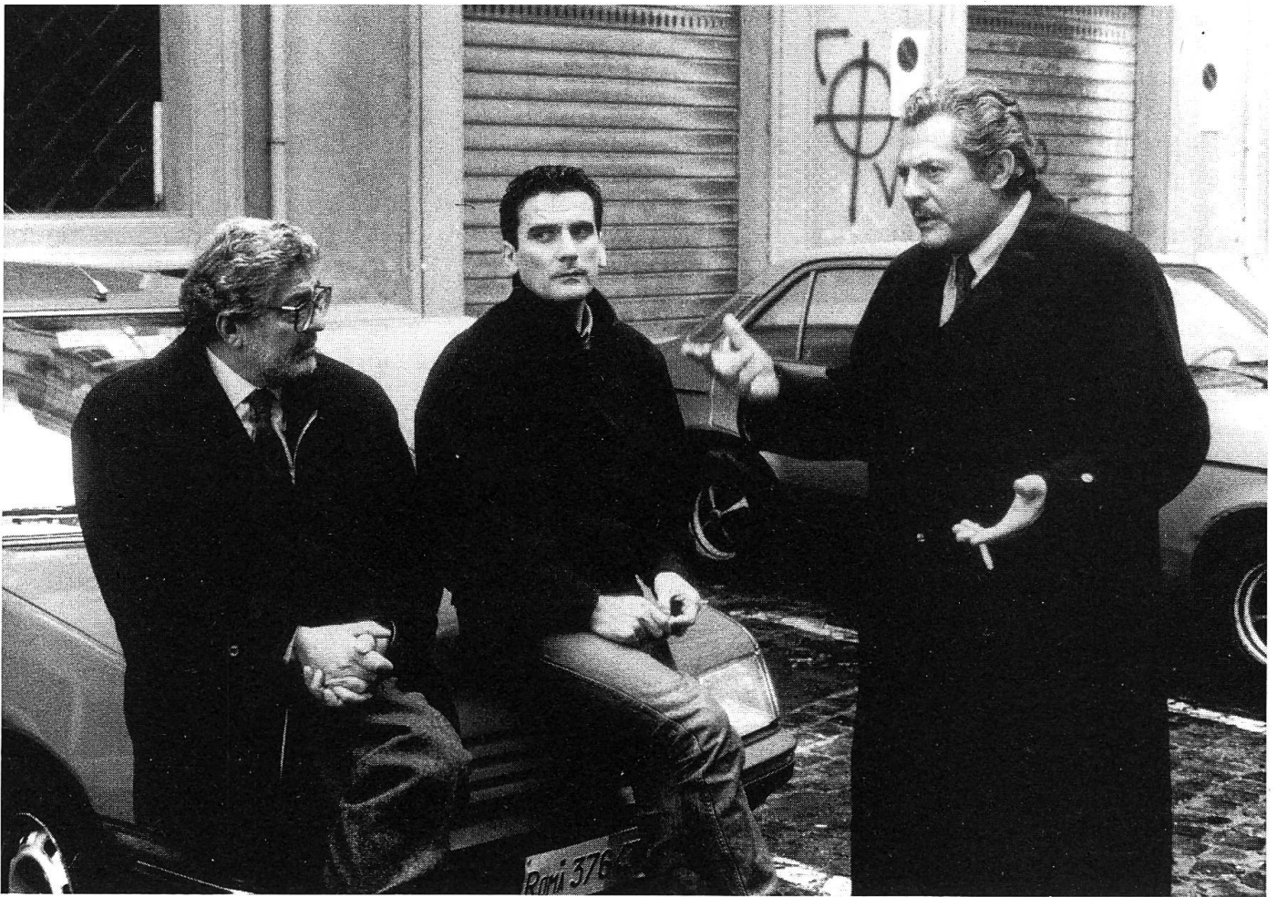
Begegnung der Generationen: Marcello Mastroianni (rechts) und Massimo Troisi (Mitte) im Gespräch mit Ettore Scola.

Papa gefallen die Sirenen nicht. Sie erinnern ihn an den Krieg. An eine Zeit, in der sechs Silberlöffel, in einer Blechdose verpackt, das ganze Vermögen darstellten, das man zum Klang der Sirenen, beim Gang in den Luftschutzraum stets mit sich trug. Was für Papa böse Erinnerung, ist für Michele eine Zeit, der er eine traurige Romantik abgewinnt. «Vielleicht war das schön damals, als der Besitz von sechs Silberlöffeln noch so viel bedeutete.»