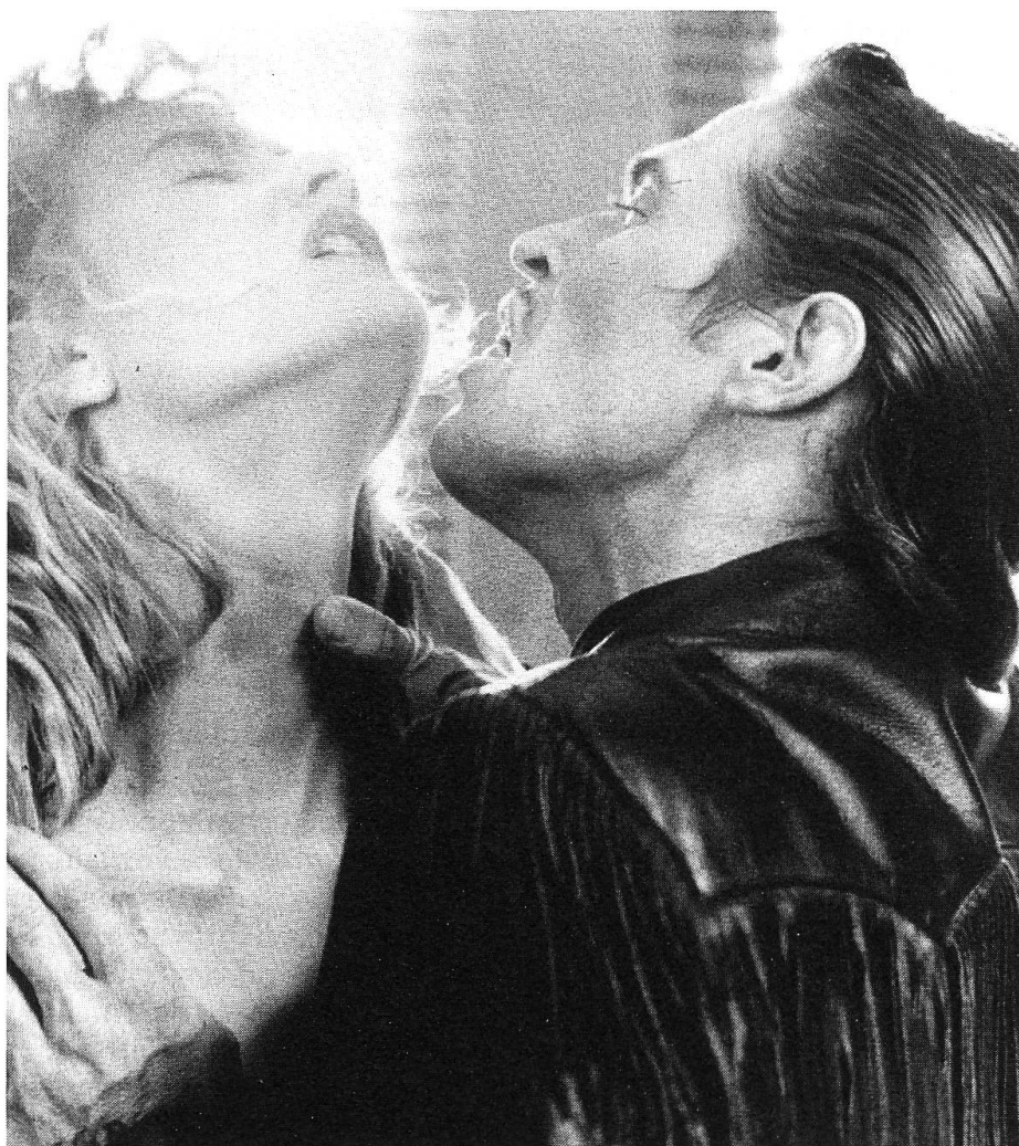
Ausgeburten düsterer Phantasie...

Entscheidend ist die Montage, die einem kontrastreichen, musikalischen Rhythmus folgend die visuell geformten Stimmungen stützt, dehnt oder bricht. Einem virtuosen Schlagzeuger gleich springt David Lynch äusserst präzise mit Bild und Ton um; jede Interpunktion, jede Synkope und jedes Ritardando sitzt. Dabei fällt den unverhofft auftauchenden Erinnerungsfetzen die formale Bedeutung von Zäsuren zu. Zäsuren als Mittel zur Rhythmisierung und zugleich inhaltliche Anspielungen sind auch die wiederholt eingeschobenen Grossaufnahmen von sich entzündenden Streichhölzern und aufglühenden Zigaretten, die durch die überdimensionier-