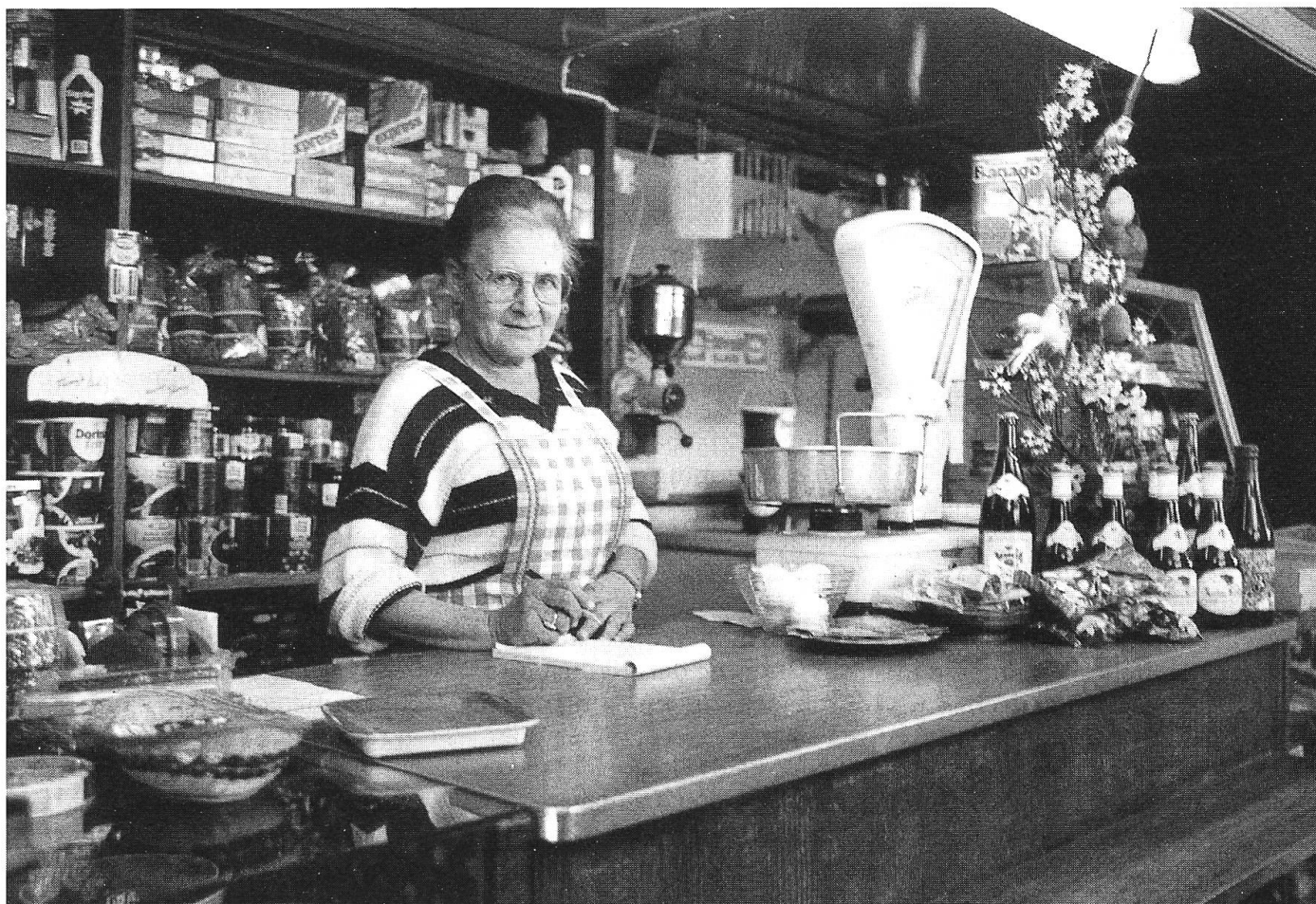
Das Brot auf den Tisch bringen: Spezereiladen im Appenzell.

andere Meinungen; Frauen und Männer lebten ja auch zusammen, und für beide gälten die gleichen Rechte und Pflichten.