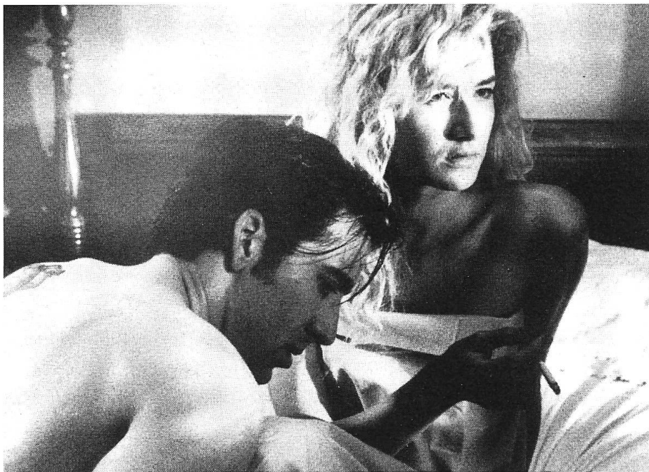
Flucht in die Leidenschaft: Nicolas Cage und Laura Dern in «Wild at Heart».

kum durch den Wissensvorsprung klar – in die tödliche Falle von Lulas Mutter gegangen ist: Sailor und Lula landen auf ihrer Flucht in den Süden der USA so ziemlich ausgebrannt im abgewrackten Big Tuna. Dort lernen sie Bobby Peru und Perdita Durango (ein pomadiert schlüpfriger Willem Dafoe und eine schauerlich blonde Isabella Rossellini) kennen, die, im Auftrag von Lulas Mutter, Sailor definitiv aus dem Weg räumen sollen. Bobby Peru schlägt Sailor einen einfach zu bewerkstelligen Banküberfall im nahe gelegenen Mexiko vor. Sailor macht mit und steht wenig später in der Bank vor dem Lauf von Bobbys abgesägter Schrotflinte, derweil Perdita draussen im Auto wartet. Kein Ausweg also, wäre da nicht ein Polizist (!), der zufällig vorbeikommt. Draussen fällt ein Schuss, Sailor rennt davon, Bobby verfolgt ihn und bleibt letztlich selber auf der Strecke.