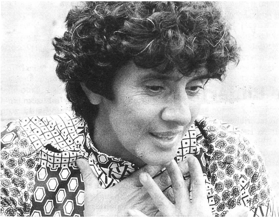
«Zum hundertsten Mal» von Kristina Konrad und Graciela Salsamendi

behandelt, sondern fällt zum Teil in den Bereich der bildenden Kunst, zum Teil in den Bereich Film.