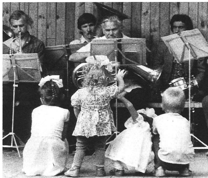
Von der Internationalen- und der Ökumenischen Jury als bester Film ausgezeichnet: «Es waren einmal sieben Simeons...».

Durch den Verzicht auf Demagogie, durch die Wahl differenzierter Stilmittel sowie durch die intelligente Verschlüsselung zeichnet sich der sowjetisch-lettische Beitrag « Es waren einmal sieben Simeons... » von Vladimir Eisner und Herz Frank aus. Der Film, der sowohl die Goldene Taube als auch den ersten Preis der ökumenischen Jury erhielt, geht von einem schrecklichen Verbrechen aus. Beim missglückten Versuch einer Flugzeugentführung kommen eine Mutter und fünf ihrer acht Kinder ums Leben, indem sie sich entweder selbst oder gegenseitig erschiessen. Auf die Frage, wie und warum eine solche Tragödie entstehen konnte, suchen die Autoren nach vielschichtigen Antworten. Am Anfang steht die scheinbare Erfolgsstory einer Familie, die mit populärer Jazzmusik das Interesse der Öffentlichkeit auf sich zu ziehen vermag und der es dadurch gelingt, den ärmlichen sibirischen Verhältnissen zu entkommen. Trotz des Erfolgs beim Publikum werden sie jedoch in Fachkreisen als spassige Exoten