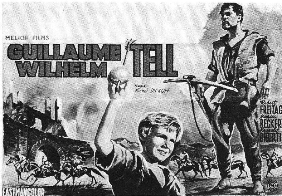
Gesichter von gestern: «Wilhelm Tell (1960)