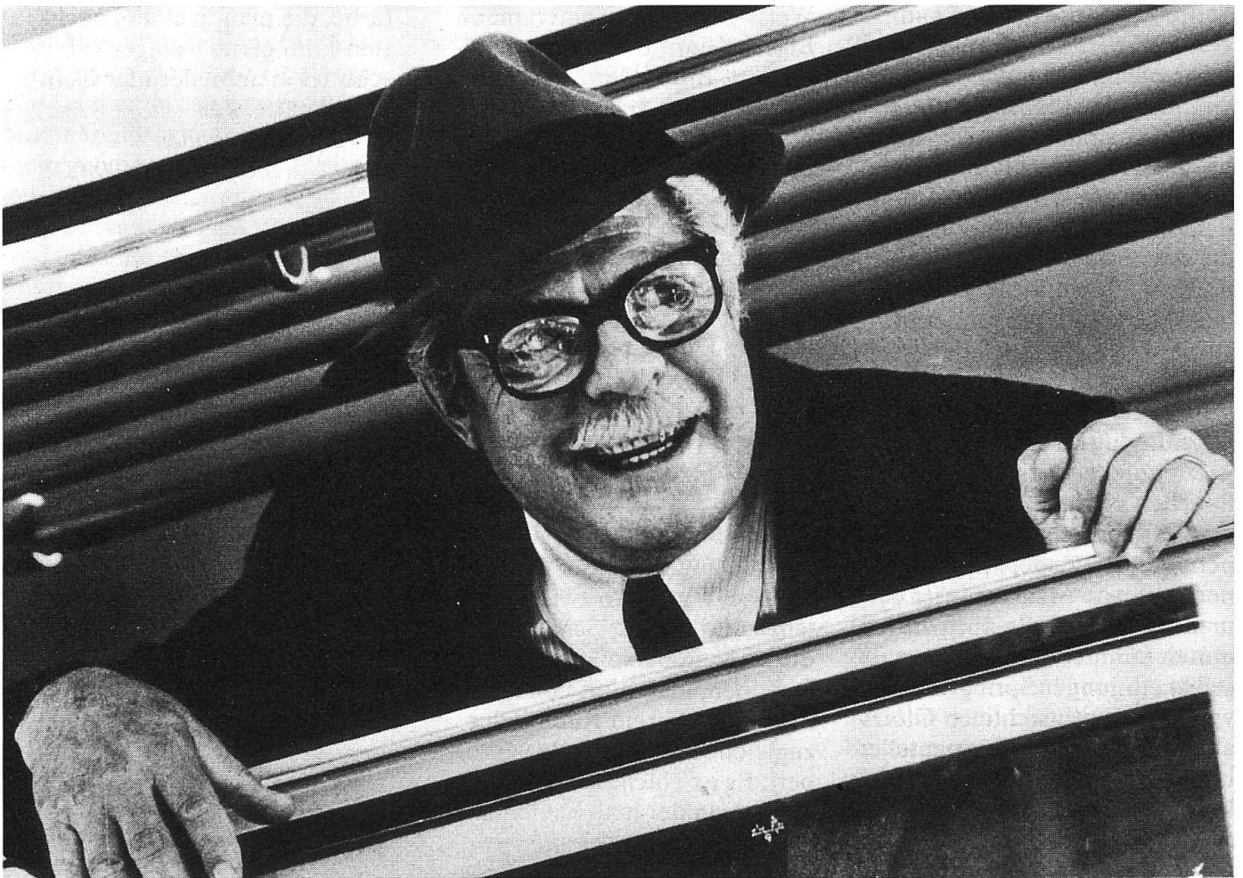
Abschied eines Vaters von seinen Kindern: Marcello Mastroianni in «Stanno tutti bene».

Ton der Elegie wahrhaftig klingen lässt und nicht bloss rhetorisch. Schon im ersten Film gerann ihm der Schmelz der Erinnerung gelegentlich zum Schmalz der Nostalgie. Aber in «Stanno tutti bene» geht es um mehr als nur die Vergänglichkeit des Kinos, die den nicht ganz klaren Blick durch den Tränenschleier durchaus noch erträgt. Hier geht es ans Lebendige, um eine Vergänglichkeit von existentiellen Dimensionen, der man mit süßer Traurigkeit alleine nicht beikommt. Denn dieser zweite Film will einen Abschied vom Leben schlechthin zeigen: Der Abschied eines Vaters von seinen Kindern, eines Mannes von seiner Frau (die oh-