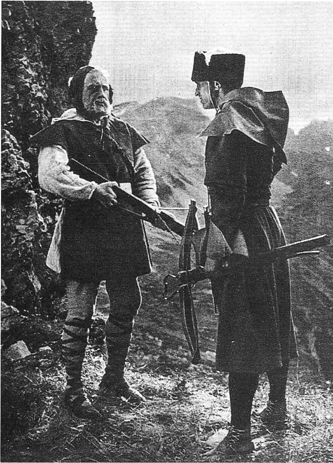
Schillers Held «neu» interpretiert: «Wilhelm Tell» von Heinz Paul.

nen durchaus repräsentativen Ausschnitt der ersten Jahre nationalsozialistisch kontrollierter Spielfilmproduktion. In diesen Filmen sind einige wichtige Elemente der NS-Ideologie vertreten: die Heroisierung einzelner Führerfiguren, das kontrastierende Bild der Geschlechterrollen, soldatischer Geist und Militarismus, die Abrechnung mit Versailles, die Forderung nach Kolonien, die Glorifizierung der Natur und die Bergsymbolik, die Massenveranstaltungen, verbunden mit marschierenden Kolonnen und Marschmusik. Ein fanatischer deutscher Nationalismus bildete den Rahmen des Filmprogramms im Terra-Kino.