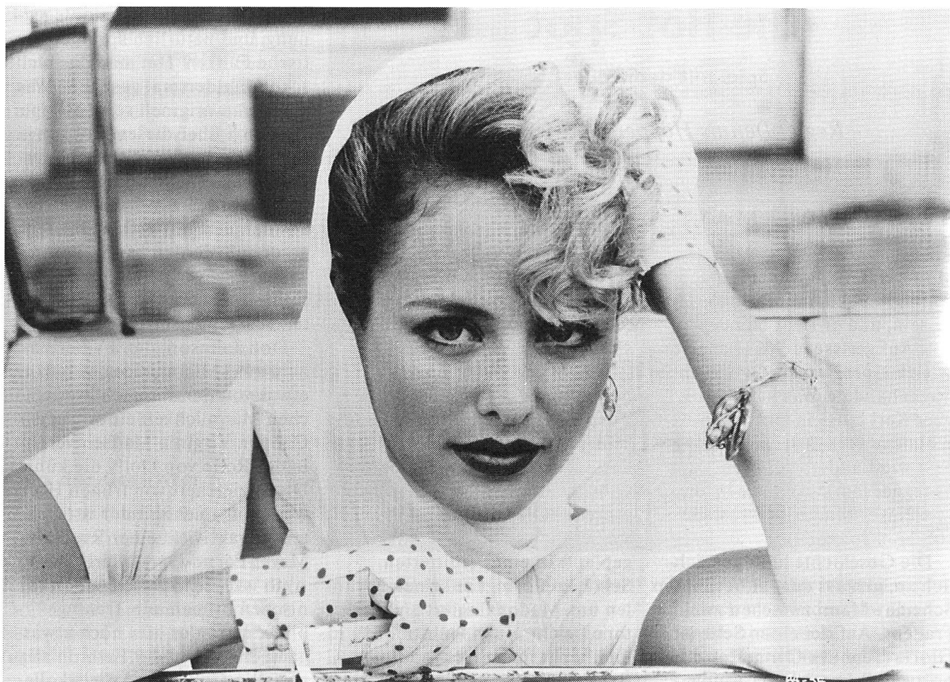
Virginia Madsen als Dolly: Typisch postmodernes Kunst- Produkt.

triebenheit der Szene macht den Reiz aus. Das Bild könnte vom Modefotografen Helmut Newton inszeniert sein. Diese verlorene Unschuld, das fortwährende Wissen darum, dass wir es mit einem Kunst-Produkt und nicht mit der Wirklichkeit zu tun haben, scheint mir ein typisch postmodernes Merkmal zu sein.