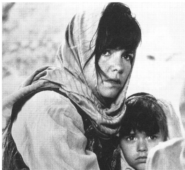
5. «Not Without My Daughter» (476 993)