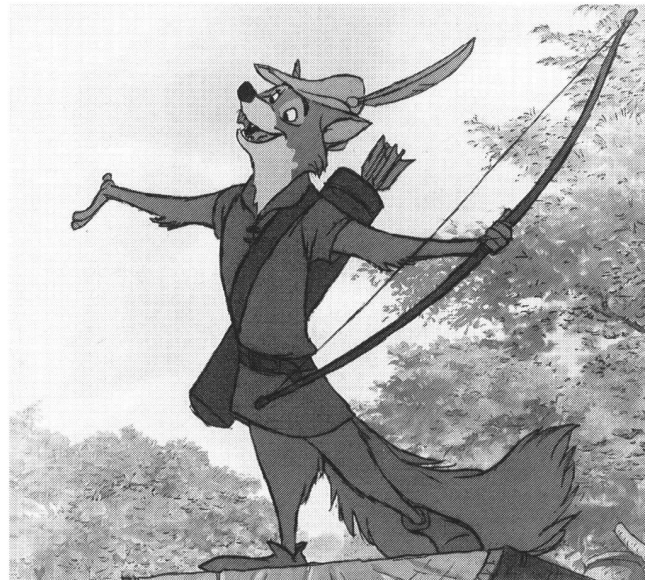
«Robin Hood» schröpft die Reichen, schützt die Unterdrückten