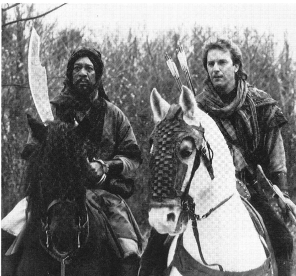
3. «Robin Hood – Prince of Thieves» (528 112)