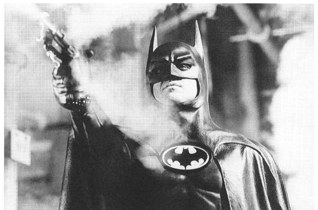
«Batman» kämpft gegen Verbrechen, Korruption und Drogen