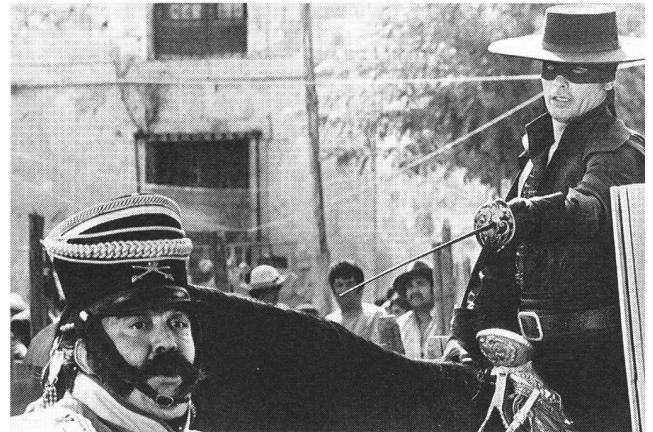
«Zorro» Beschützer und Befreier der Armen und Wehrlosen

Georg Seesslen, der Verfasser dieses Artikels, ist Autor der zehnbändigen Buchreihe «Geschichte und Mythen des populären Films». Der Kritiker und Essayist lebt im Allgäu und wurde in diesem Jahr mit der «Goldenen Filmspule», dem Preis der kommunalen Kinos in Deutschland, ausgezeichnet.