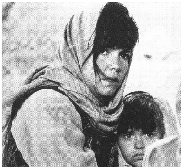
5. «Not Without My Daughter» (476 993)