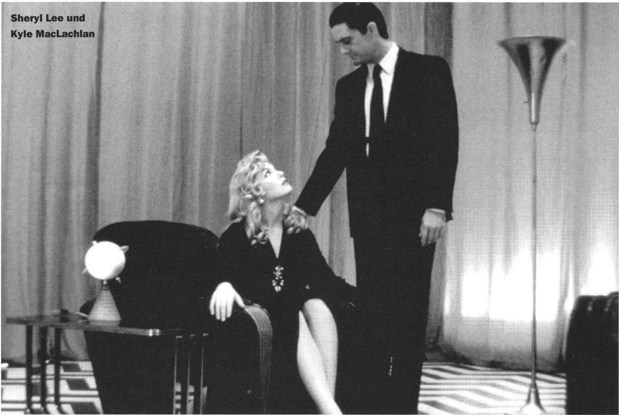
Sheryl Lee und Kyle MacLachlan

Zimmer in einem Sessel, auch der Zwerg und der Einarmige, Leland/Bob und Dale Cooper sind da. Bei Laura zu Hause hing ein kitschiges Bild an der Wand, auf dem ein Schutzengel im Kreise einiger Kinder zu sehen war. Irgendwann hatte Laura entsetzt bemerkt, dass der Schutzengel vom Bild verschwunden war. Im Eisenbahnwaggon erschien Ronette Pulaski (Phoebe Augustine), Lauras Leidensgenossin, deren Schutzengel, der dafür sorgte, das Ronette lebend aus dem Waggon herauskam. Nun, in der langen Schlussequenz schwebt zu den Klängen von Luigi Cherubinis «Requiem in C-Moll» Lauras eigener Schutzengel von der Decke herab, der sie zuvor anscheinend verlassen hat, und Laura ist auf einmal glücklich und wirkt wie befreit.