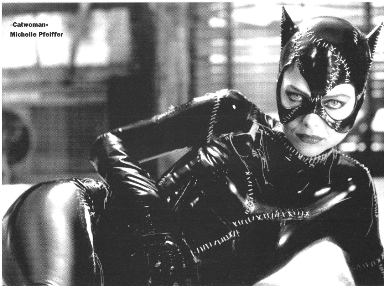
«Catwoman» Michelle Pfeiffer

Batman ist seit fünf Jahrzehnten beliebt, obwohl eigentlich ziemlich anachronistisch, eine Lichtgestalt, die sich den trüben urbanen Sümpfen entgegenstemmt. Wer weiss, wieviele Stimmen der grüblerische, konservative Einzelkämpfer erhielt, wenn er sich als Bürgermeister oder als Stadtrat zu bewerben beliebt! Flieg, Batman, flieg und schlag zu, wenn's nicht anders geht, das ist die wahre Philosophie, die hinter dem Charakter der Kultfigur döst. Und dies ist immerhin mehr als eine Überlegung wert. ■