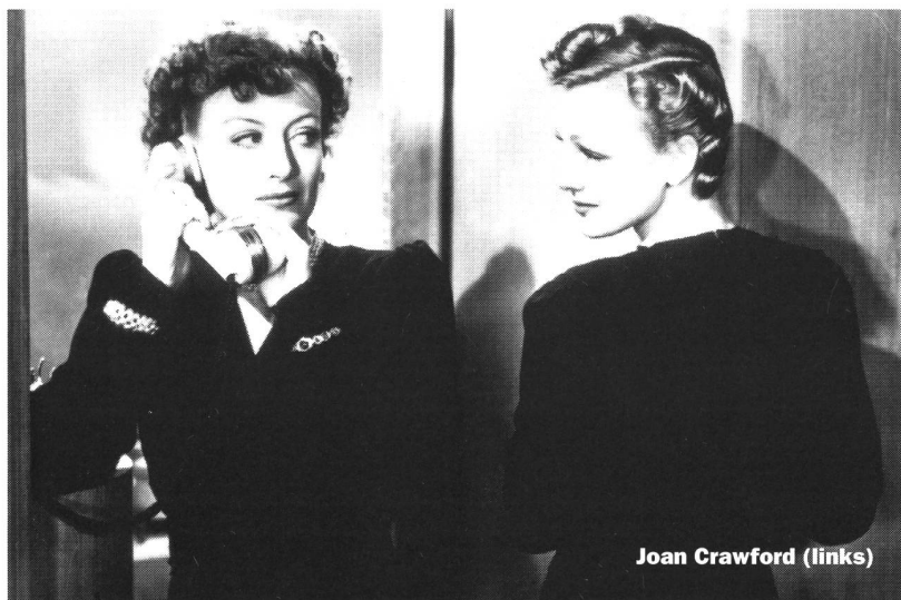
Joan Crawford (links)

Die Unterscheidung zwischen «women» und «females» bleibt aber bestehen. Mary Haines, Repräsentantin der ersten Gattung, gibt ihre Redlichkeit, durch die sie sich von der zweiten Gattung absetzt, nicht auf. Sie muss einfach lernen, dass Ehe nicht nur Happiness bedeutet und auch ihr Stolz erst an zweiter Stelle kommt. «After all I got my pride», sagt sie zu ihrer Mutter, die ihr aber erklärt, dass Eheleute in schlechten Zeiten zusammenhalten müssen. Und dass es Stephen sehr schlecht gehe, darauf weise gerade der Ehebruch hin, denn Ehebruch sei dasselbe wie Pocken: eine Krankheit. Männer hätten einfach nie gelernt, mit ihrer eigenen Unzufriedenheit umzugehen. Anstatt sich etwas Neues zu kaufen, was jede vernünftige Frau tun würde, nähmen sie sich eben eine Geliebte und gefährdeten damit eher ungewollt den Ehefrieden.