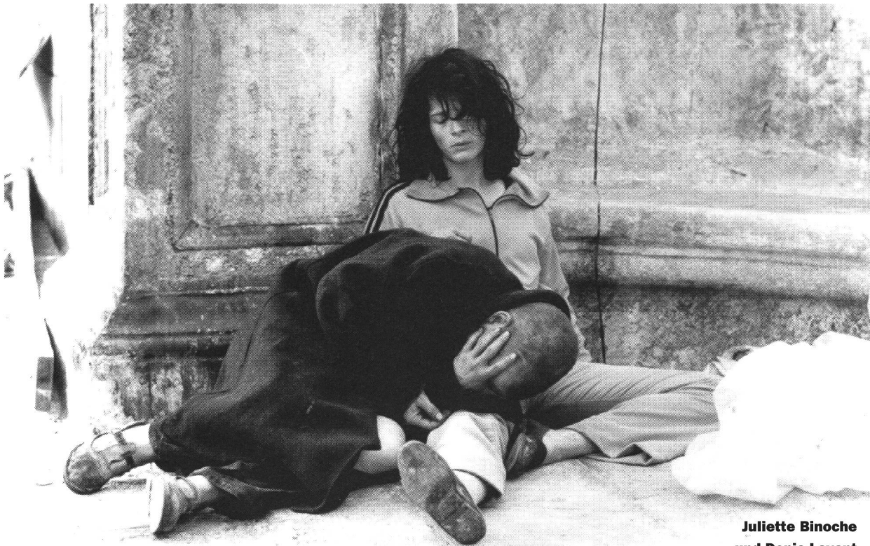
Juliette Binoche und Denis Lavant

heisst. So jäh kann der Absturz aus den Höhen des Glücks in die Tiefe der Verzweiflung sein. Und so gemein kann das Leben sein: Nachdem Alex alle Plakate verbrannt hat, dabei sogar den zufälligen Tod eines Menschen in Kauf genommen hat, und Michèle erleichtert und glücklich in die Arme schliesst, löst seine Umarmung den Kontakt im defekten Kofferradio aus, das sie in der Hand hält. Während Michèle aus dem Radio vernimmt, dass eine Operation ihr Augenlicht retten kann, und von einem Hoffnungstaumel erfasst umhertanzt, steht Alex vor einem Scherbenhaufen.