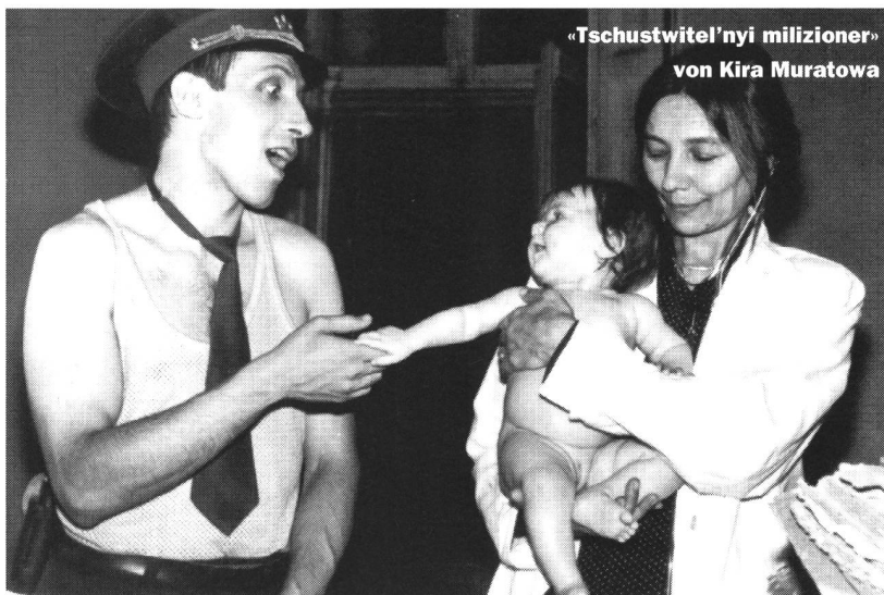
«Tschustwitel'nyi milizioner» von Kira Muratowa

such, allgemeine Aussagen zu machen. Es bleibt ein verschlüsseltes Dokument einer Schreherrschaft. Hier wie auch in «Valsi Pečoraze» der Georgierin Lana Gogoberidze kommt ob der unnötig repetitiven Filmsprache Langeweile auf. Der georgische Film über die Schrecken der Stalinzeit erzählt in drei parallelen Strängen die Schicksale von Anna, die aus dem Waisenhaus davonläuft und in der ehemaligen Wohnung ihrer Eltern auf einen KGB-Offizier stösst, ihrer deportierten Mutter sowie von der glücklichen grossbürgerlichen Vergangenheit ihrer Familie. Es bleiben hier nebst formalen Fragen auch politische offen. Ulkig, bissig-selbstkritisch hingegen Kira Muratowas Film «Tschustwitel'nyi milizioner» vom sentimental Polizisten, der zwischen den Kohlköpfen einen Säugling findet und ihn adoptieren möchte: eine Lektion in russischem Humor.