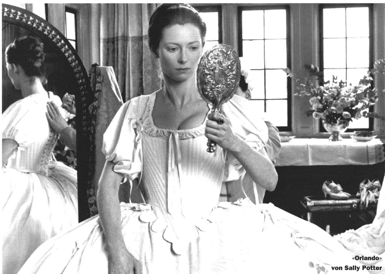
«Orlando» von Sally Potter