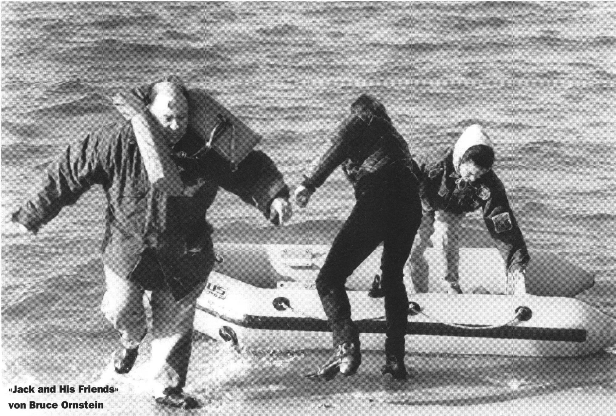
«Jack and His Friends» von Bruce Ornstein

Amerikas aus anderer, lateinamerikanischer Sicht zu beleuchten. Die «Opera prima» bot eine farbenfrohe Palette von Erstlingsfilmen, unter ihnen « Jack and His Friends » des amerikanischen Regisseurs Bruce Ornstein. Soeben hat Jack seine Ehefrau mit einem Liebhaber angetroffen. Frustriert fährt er über Land und wird von einem mehr oder weniger kriminellen jungen Paar im eigenen Auto in sein eigenes Wochenendhaus auf eine Insel an der Ostküste der USA entführt. Bald sieht sich der biedere, ältere Mann den unmöglichsten Situationen ausgesetzt und raubt sogar unfreiwillig einen Laden aus. Ein kleiner, mit geringem Budget gemachter Film, schnell, witzig, bescheiden und sympathisch. Ein Film, der wie etliche andere Erstlingswerke der «Opera prima» dem Wettbewerb mehr als gut getan hätte.