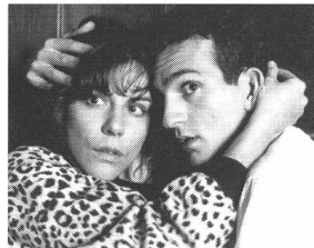
«Die Zweite Heimat»