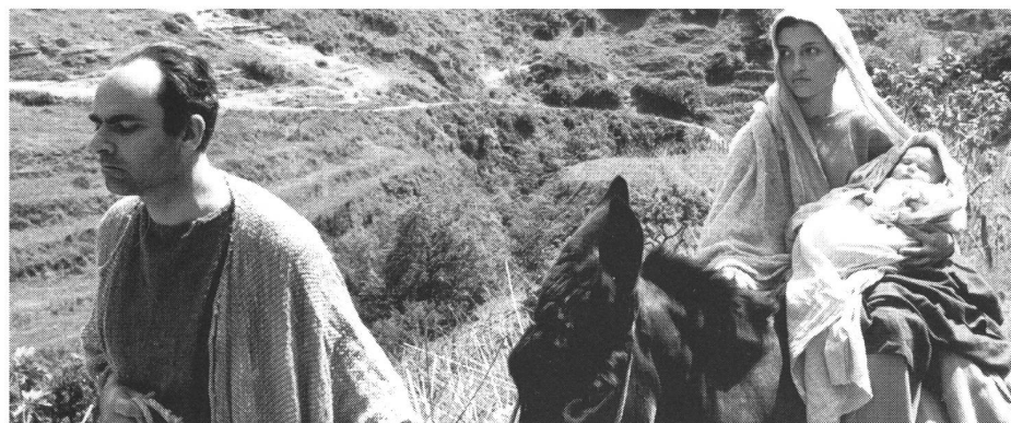
«Il vangelo secondo Matteo» von Pier Paolo Pasolini