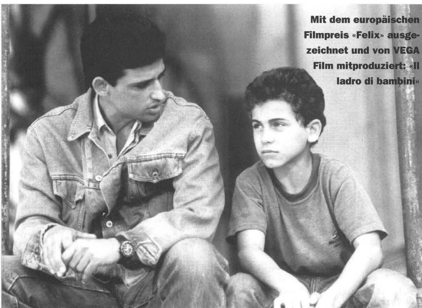
Mit dem europäischen Filmpreis «Felix» ausge- zeichnet und von VEGA Film mitproduziert: «Il ladro di bambini»

Verleihförderung betreibt, wäre direkt gekoppelt gewesen mit einer Annahme der EWR-Vorlage. Das heisst: Die Schweiz muss jetzt aussteigen, und zwar auch aus jenen Teilprojekten, bei denen sie bereits aufgrund früherer Verträge mit dabei war. Weiter wie bisher laufen nur zwei Dinge: ein multilaterales Koproduktionsabkommen, das zur Zeit in Arbeit ist, und das Programm EURIMAGE des Europarates, das mit EWR und EG ebenfalls nichts zu tun hat.»