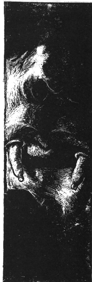
DRACULA , USA , 1989