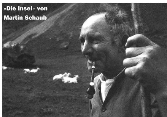
«Die Insel» von Martin Schaub