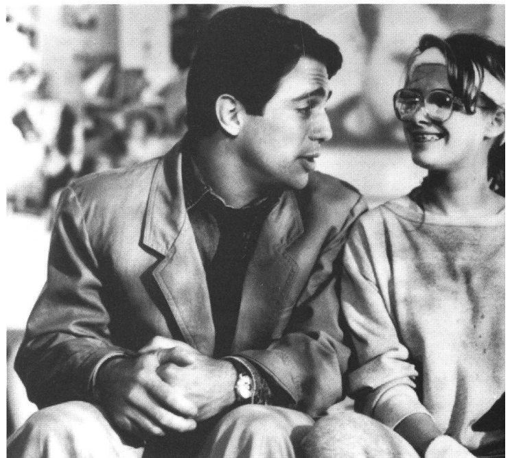
Verwandlung der unattraktiven Brillenträgerin...

Für die Erklärung oder Beschreibung einer vielleicht anders gearteten weiblichen Schaulust kann man auch Freuds Konzept von der potentiellen Trennung der Sexual- und Selbsterhaltungsinstinkte im Schautrieb heranziehen. 24 Das Auge dient ebenso