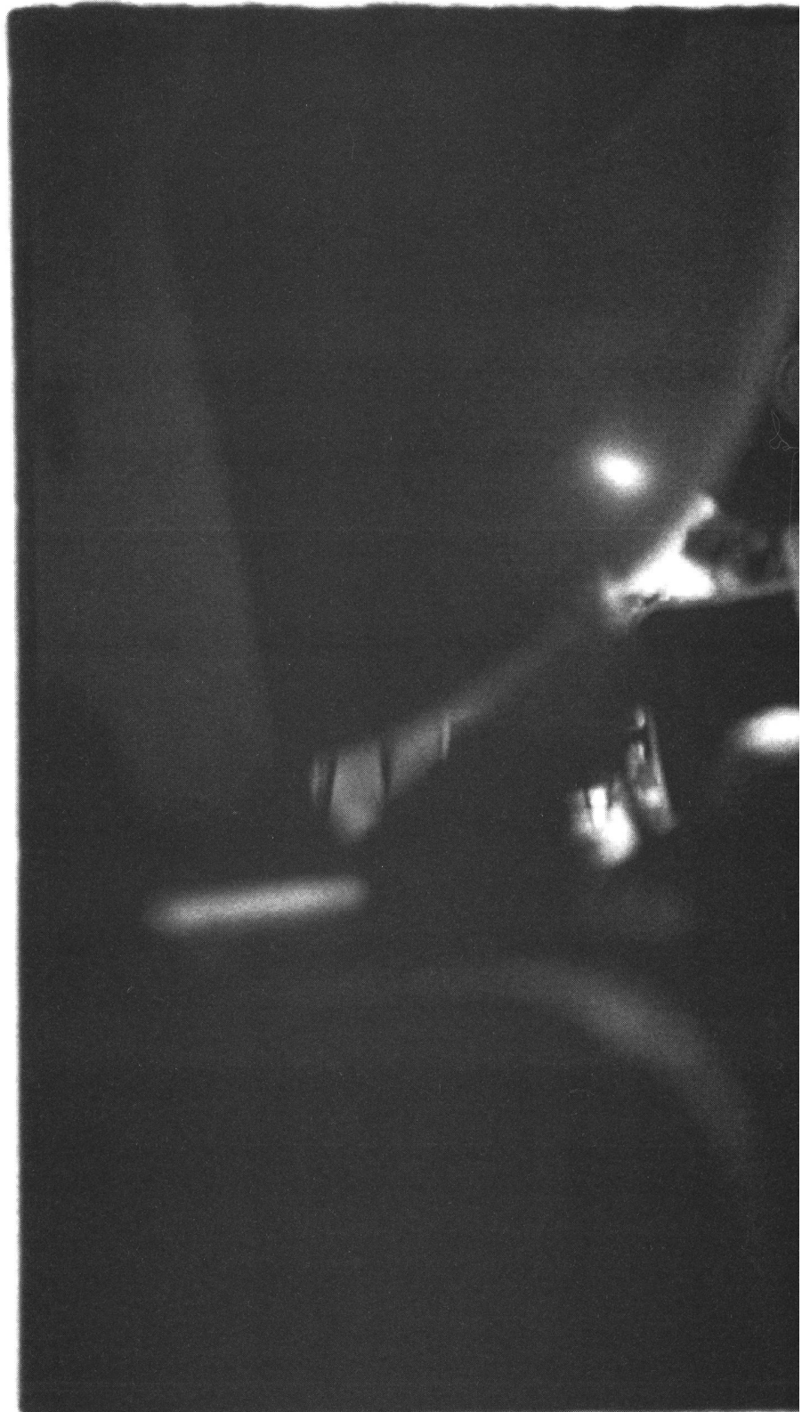
*(Bilder S. 21, 22, 23: Zoom-Dokumentation)

D as Wissen um einen «verbotenen» weiblichen Blick, insbesondere angesichts der «Macht» des Gesetzes und der Tradition, wird schon in Lewis Carrolls 1865 erschienenem Buch «Alice's adventures in Wonderland» schon dem kleinen Mädchen in den Mund gelegt – eine folgenreiche Sozialisation für das Bild und den Blick der Frauen wird in der Episode angesprochen, in der Alice in Begleitung einer Katze auf den König trifft. Die Katze mustert diesen unverhohlen und neugierig. Das stürzt den König in grosse Unsicherheit und er herrscht das Tier an: «Don't be impertinent, and don't look at me like that!» Daraufhin meint Alice erklärend und entschuldigend: «A cat may look at a king...» 1 – und man möchte ergänzend hinzufügen: eine Frau jedoch nicht.