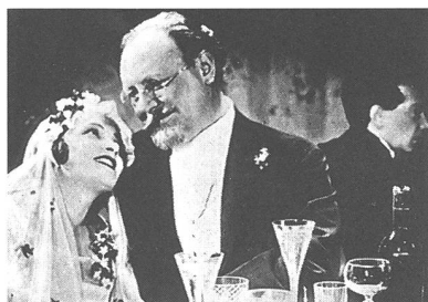
«Der blaue Engel»

Regie: Merian C. Cooper (USA 1933), mit Fay Wray, Robert Armstrong, Bruce Cabot. - Der tricktechnisch brillante Monsterfilm aus dem Jahre 1933 wurde zum Klassiker seines Genres. Die phantastischen Dekors der Urwelt des Riesenaffen Kongs und die «Special Effects» von Willis O'Brian sind bis heute unerreicht. Das künstlich verlängerte Gebrüll des Affen und der langgezogene Schrei der «weissen» Frau in der Faust des Affen machten Filmgeschichte. - Rialto Video, Zürich.