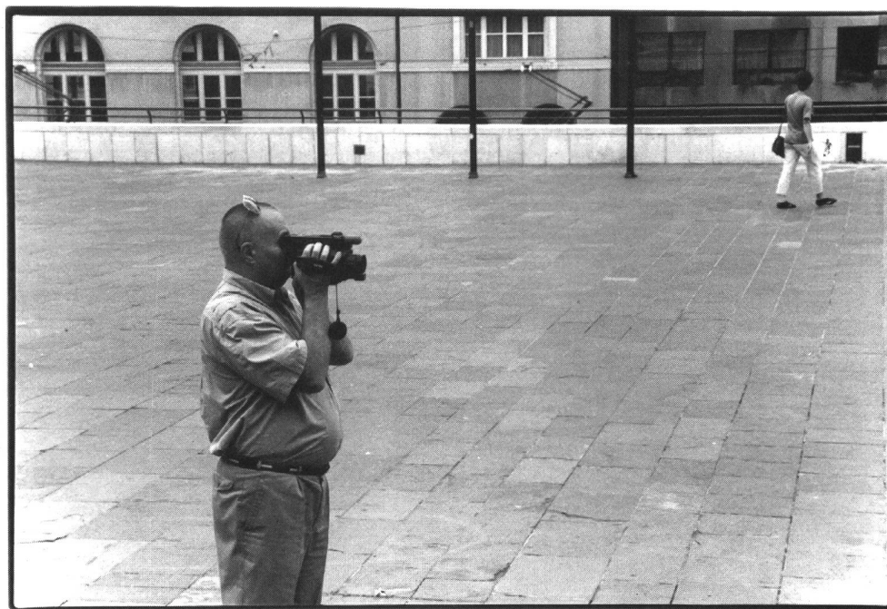
Männer sind «Träger des Blicks», haben Probleme wenn sie zum Objekt werden

Eine derartige geschlechtsspezifische Kodifizierung des Blicks – erzeugt mit den gängigen filmischen Verfahrensweisen des konventionellen Spielfilms – schreibt den Mann als «Träger des Blicks» und die Frau als «Objekt des Blicks» fest. So bezeichnete Laura Mulvey schon 1973 jenen das Hollywoodkino bestimmenden Mechanismus. Dieser liess sie danach fragen, welche Formen und Funktionen dabei das Bild der Frau im herrschenden Kino einnimmt und welche Zuschauerposition implizit für beide Geschlechter erzeugt wird. 3 Erstmals wurde hier mit den Mitteln einer lacanistisch gelesenen, freudianischen Psychoanalyse Kritik am patriarchalen Kino geübt, dessen Zuschauer als implizit männlich identifiziert und somit die Frage nach dem Ort und den Möglichkeiten der weiblichen Zuschauer aufgeworfen. Laura Mulveys Text verweist – trotz seiner Grenzen und Leerstellen – darauf, dass das Blicken keine neutrale Aktivität darstellt. Bis heute liegt die Stärke von Mulveys Artikel darin, dass er auf eine geschlechtsspezifische Konditionierung des Blicks und des Schauens aufmerksam machte, und dass er genau beschrieb, welchen Blick-