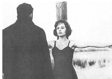
«Rocco e i suoi fratelli»

Regie: Howard Hawks (USA 1948), mit John Wayne, Montgomery Clift, Walter Brennan. - Ein autokratischer Rancher muss einsehen, dass die alten Ideale des «Wilden Westens» neuen Werten weichen müssen. Hawks verbindet in seinem ersten grossen Western epische