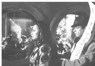
«Le petit criminel»