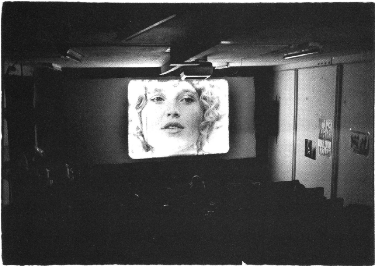
Der weibliche Blick: sinnlich statt klassifizierend; «sinnlich sehen» können allerdings auch Männer.

Rezeption, für die Formen des Sehens und die Triebkonstitution des Blickes, hingewiesen. Doch wenn sich gegen die den Blick bestimmenden Strategien der Kamera und die vor allem männliche Dispositionen ansprechende Funktionsweisen des Kinos eine an andere Triebe und Lüste anknüpfende Schaulust aktivieren lässt – dann stehen auch Männern (weil es sich eben nicht um biologisch fundierte, sondern um kulturell und sozialhistorisch entwickelte Eigenschaften handelt) die potentiell subversiven Qualitäten eines Blicks offen, der nicht unbedingt an der Bedeu-