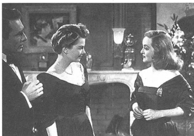
«All About Eve»

Regie: Luchino Visconti (Italien 1960), mit Annie Girardot, Alain Delon, Renato Salvatori. - Eine nach Mailand emigrierte süditalienische Bauernfamilie zerbricht an den Lebensbedingungen der Industriegesellschaft im Norden. Zwei der Brüder treibt der Milieuwechsel in eine blutig endende Auseinandersetzung. Teile des noch im Neorealismus wurzelnden gesellschaftskritischen Dramas wurden von den Zensurbehörden gekürzt. Das ZDF hat die ursprüngliche Filmversion rekonstruiert und die zusätzlichen Szenen deutsch unterteilt (und damit kenntlich gemacht). - 22.00, ZDF. → ZOOM 19/83