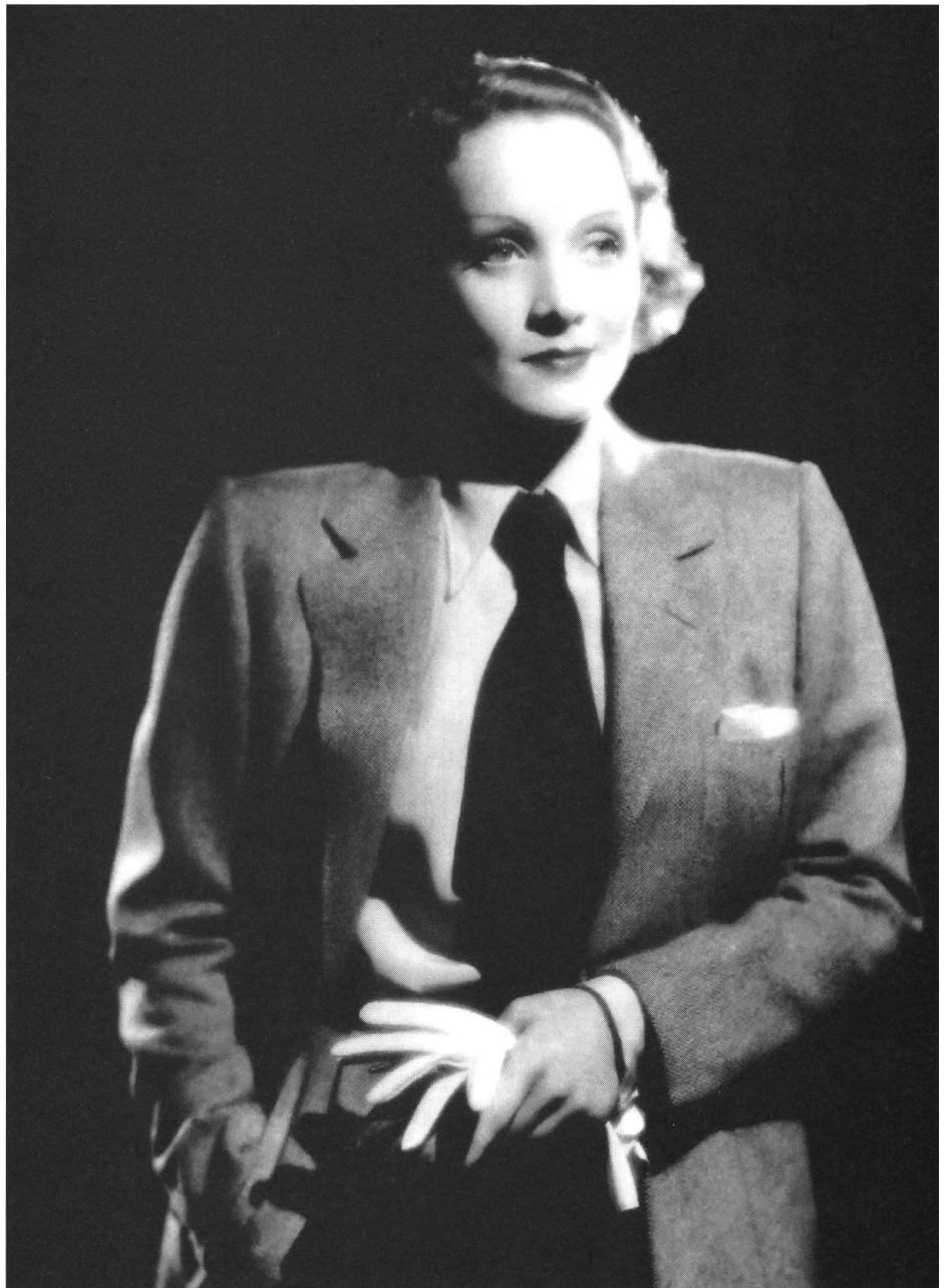
Der Erfolg Marlene Dietrichs bei Frauen und ihr bei einem Teil der Männer geerntetes Missfallen gründet nicht zuletzt auf ihre schillernde androgyne Ausstrahlung.

In der feministischen Filmtheorie interessierte man sich