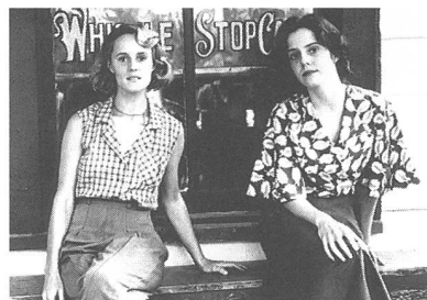
«Fried Green Tomatoes»

Regie: Ghana Tourist Development, Accra (Ghana 1992). - Von der Hauptstadt Accra ausgehend, führt der Dokumentarfilm in all die schönen Regionen Ghanas: von den botanischen Gärten Aboris zum Fluss Volta, vom Regenwald Zentralghanas in die Küstengebiete. Handwerker werden bei der Arbeit beobachtet, und es werden Einblicke in das kulturelle und soziale Leben gewährt. - Film Institut, Bern.