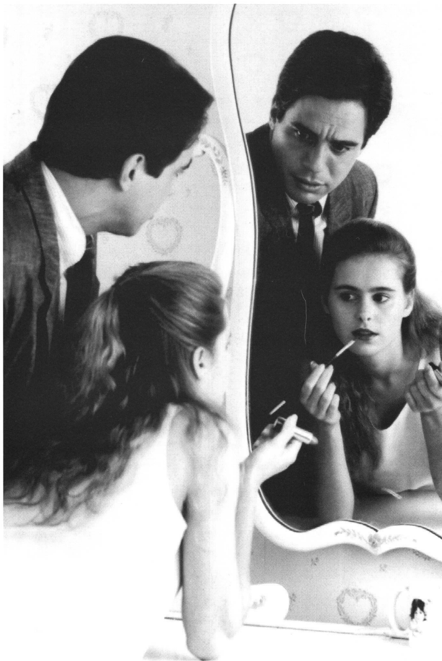
...in ein schönes, brillenloses Objekt (Keep Your Hands off My Daughter von Stan Dragoti, USA 1989)

Den Prototyp dieses Sehens könnte man im Film in der Figur des Detektivs repräsentiert finden - sein Gegenstück stellt zum einen die Frau mit Brille, zum anderen die blinde Frau dar. Welche Bedrohung vom aktiven Blick der Frau ausgeht, signalisiert die Häufigkeit dieser Figuren in der Filmgeschichte und die Problembeladenheit und Exzessivität, mit der sie gerne ausgestattet werden. In der blinden Frau ist die Bestrafung für die «verbotene Sicht» schon erfolgt, sie darf gerettet werden. Die Frauen mit Brille müssen entweder von der Brille befreit und damit in ein schönes Schauobjekt verwandelt werden oder aber sterben. 26 Gerade dieser Ausschluss der Frauen aus Blickstrukturen, die auf Beherrschung des Blickfeldes und absolute Kontrolle ausgerichtet sind, mag jedoch dazu geführt haben, dass sie «anders» sehen; dass ihre Ich-Libido (der Selbsterhaltungstrieb also) einen weniger starken Druck auf die Partialtriebe, wie beispielsweise die Schaulust, ausübt - wer kennt nicht das Diktum der freudianischen Psychoanalyse, dass Frauen ein weniger entwickeltes Über-Ich hätten.