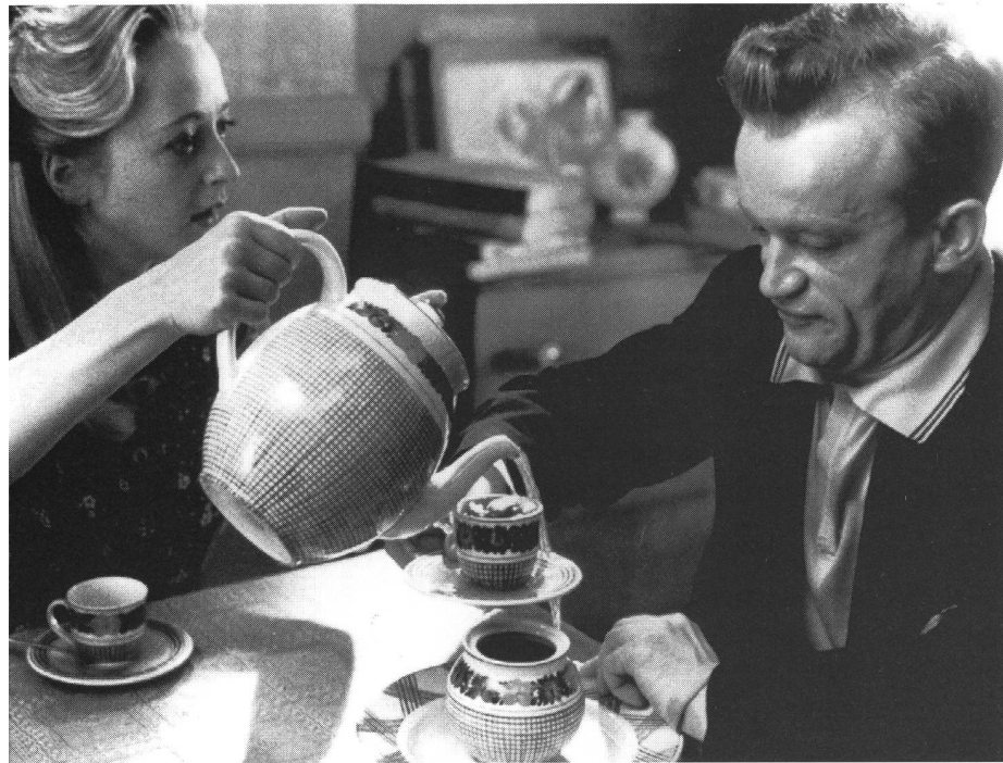
Die Brillenträgerin verliert ohne ihre Sehhilfe die Kontrolle und die Übersicht (Delicatessen von Jean- Pierre Jeunet und Marc Caro, Frankreich 1991)