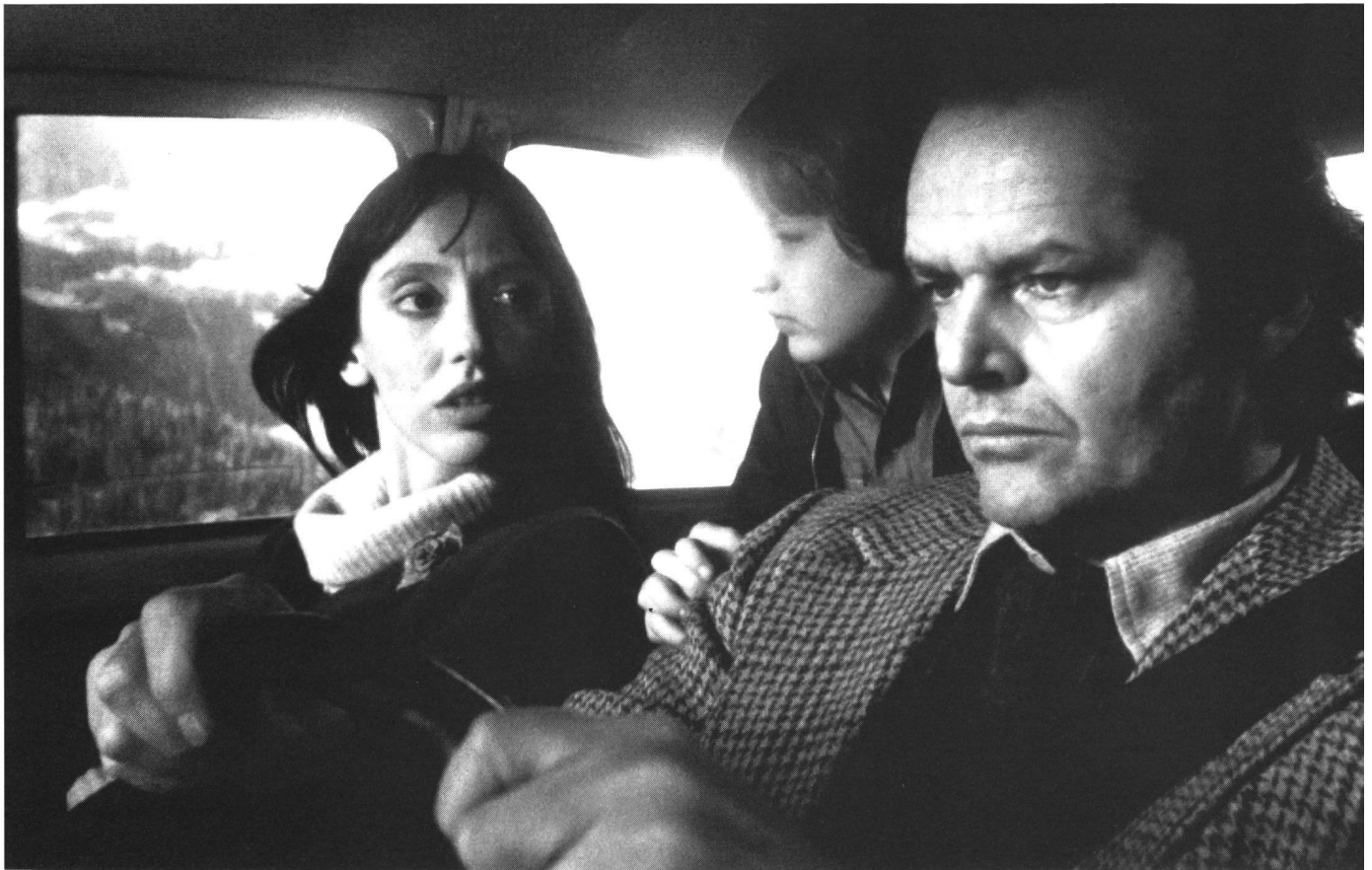
«Shining» (1980) von Stanley Kubrick

ein tief moralischer Impetus am Werk zu sein, der die Identifikation mit ambivalenten Figuren verbietet. Das ist jedoch nicht nur scheinheilig und der Sache unangemessen, um die es im Psychothriller wirklich geht; diese flache, eindimensionale Konzeption der Protagonisten hat auch unmittelbar eine ästhetische Schwäche der entsprechenden Werke zur Folge: Wenn die Helden vom Bösen nicht wirklich tangiert werden, bleiben sie allzu leicht berechenbar, und das wiederum ist dem Spannungsaufbau einer Story ja nicht eben zuträglich.