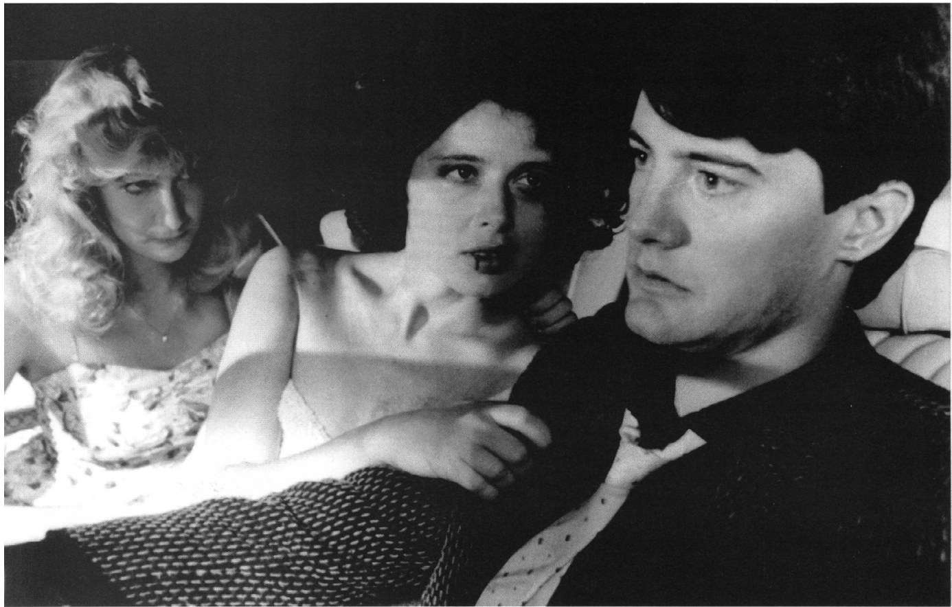
«Blue Velvet» (1986) von David Lynch

Psychothrillern, die gerade in den letzten Jahren gedreht worden sind.