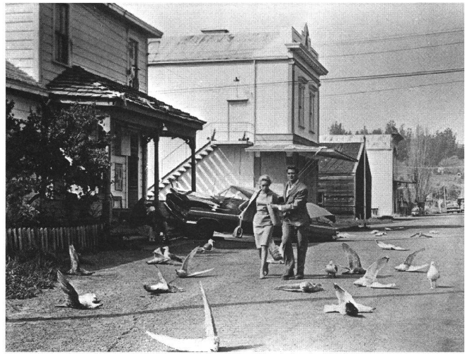
«The Birds» (1963) von Alfred Hitchcock

Ein Klassiker des Thrill hat genau dies zum Thema: die Kontrolle im Rahmen einer ganz normalen Ehe. In Polanskis « Rosemary's Baby » (1968) scheint es vordergründig zwar um so etwas Outriertes wie Zeugung und Geburt des Antichrist zu gehen; doch wenn man das Augenmerk auf die Ehespiele der Protagonisten richtet, wird rasch einmal deutlich, dass jene quasi metaphysische Ebene keineswegs wörtlich zu nehmen ist. Die Ehe zwischen Guy und Rosemary bildet die typische Versorgungskiste: Er bastelt an seiner Karriere herum, sie hat das Nestchen warmzuhalten für den Fall, dass der gestresste Eheherr doch einmal auszuspannen geruht. Das füllt nicht aus – selbstverständlich; so macht er ihr, damit sie was zum Rum-