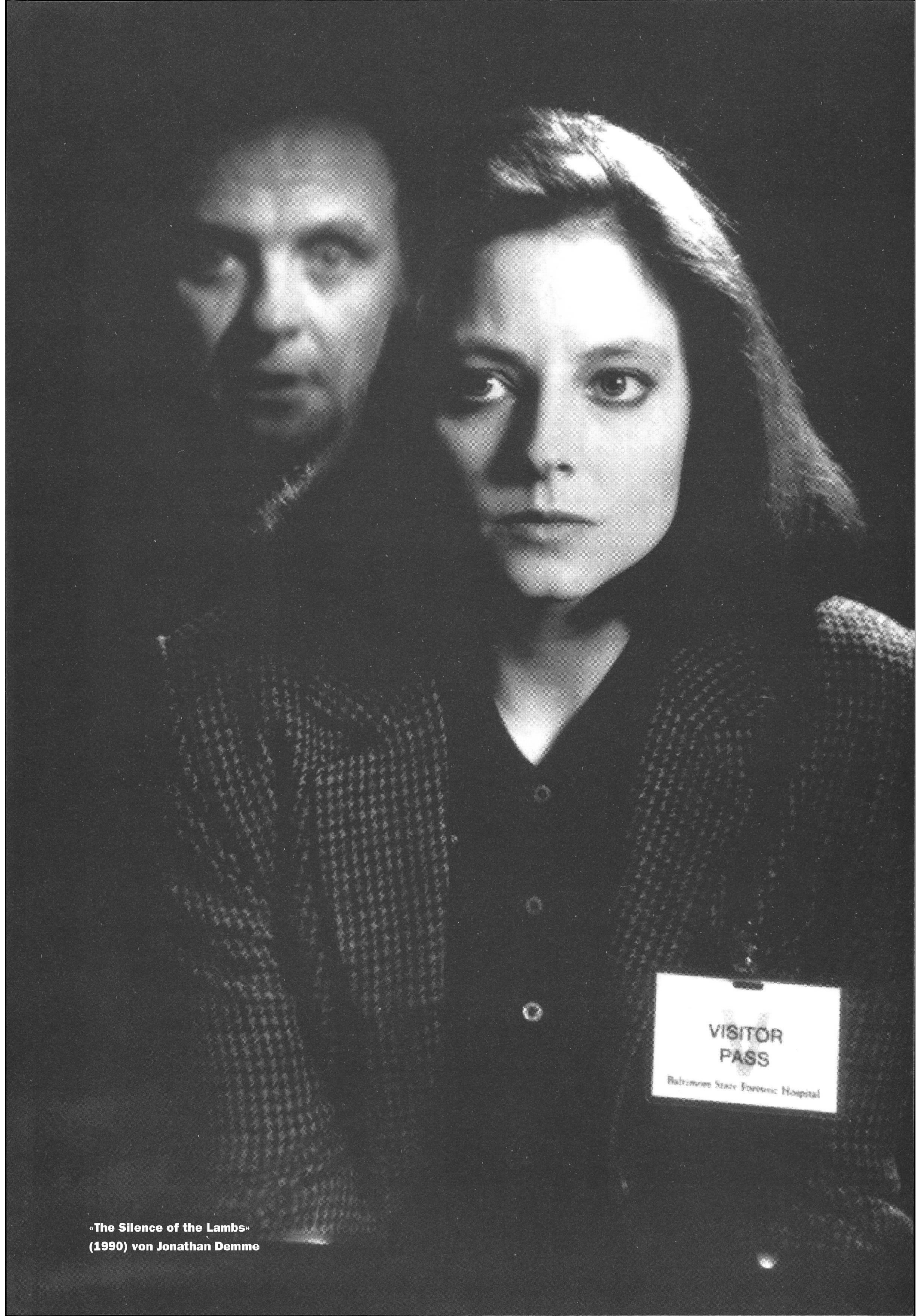
«The Silence of the Lambs» (1990) von Jonathan Demme