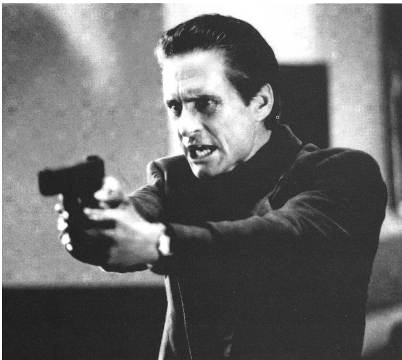
«Basic Instinct» (1992) von Paul Verhoeven

Das Sprechen über die Kehrseiten bedarf offen-sichtlich nach wie vor des Versteckspiels. Und trotz-dem: Es ist unbestreitbar, dass Psychothriller unver-gleichlich stärker wirken, die auf solche Distanzie-rungen möglichst verzichten, die ihre Helden wie auch die Zuschauer zu wirklichen Komplizen des Bösen machen. Sicher einmal sind Filme dieser Art spannen-der, weil mit der ambivalenten Anlage der Figuren weit mehr Spielmöglichkeiten gegeben sind; darüber hinaus dürften sie uns aber auch ein Mehr an kathartischer Entlastung gewähren. Denn nur sie geben uns das, was wir eigentlich vom Psychothriller wollen. ■