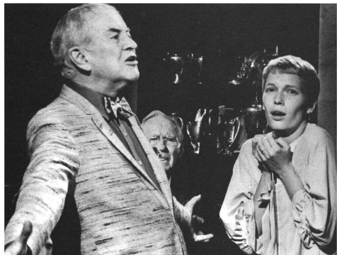
«Rosemary's Baby» (1968) von Roman Polanski

spielen hat, ein Kind. Guy bestimmt auch die sozialen Kontakte; er schneidet seine Frau zielbewusst aus ihrem bisherigen Beziehungsnetz heraus und versucht, sie in den Rahmen jener Sekte einzubinden, die für ihn so etwas wie eine Ersatzfamilie darstellt. Rosemary wird Schritt für Schritt isoliert und sämtlicher Entscheidungsbefugnisse beraubt; am Ende dieser systematischen Entmündigung wird sie nicht einmal mehr imstande sein, ihre Lektüre frei zu bestimmen.