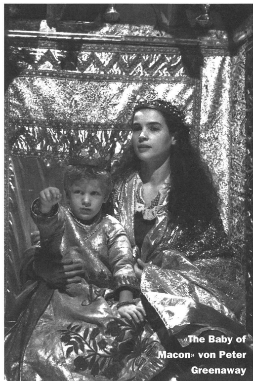
«The Baby of Macon» von Peter Greenaway

Erstaunlich ist, daß mit dem Jury-Preis für «Hsimeng rensheng» (Der Puppenspieler) von Hou Hsiao-Hsien ein Pendant zu Chens Film geehrt wurde, das in jeder Hinsicht weniger intensiv ist: Hous Biografie des Puppenspielers Li Tien Lu, der sich selbst als manipulierte Puppe fühlt, hat nichts von dem Drama, den Emotionen oder dem Spektakel zu bieten, das «Bawang bieji» kennzeich-