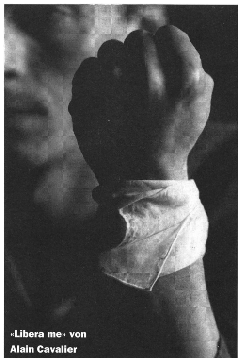
« Libera me » von Alain Cavalier

Den allermeisten Filmen des Festivals war gemeinsam, dass die postmoderne Beliebigkeit zwar allmählich einer Sinnsuche weicht, dass diese jedoch individuell, ausserhalb der traditionellen Wertsysteme und Ideologien stattfinden muss. So ist bei aller Unausgeglichenheit des Niveaus doch ein Fortschritt festzustellen, dass nämlich die ethisch-politisch-philosophische Krise nicht nur als Katastrophe, sondern als Chance zu einem Neubeginn empfunden wird. Bleibt zu hoffen, dass sich vermehrt auch Filmern und Geschichten finden lassen, die diesem Thema gerecht werden. ■