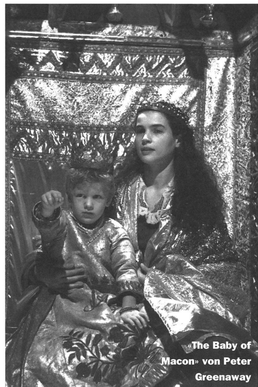
«The Baby of Macon» von Peter Greenaway

Erstaunlich ist, daß mit dem Jury-Preis für «Hsimeng rensheng» (Der Puppenspieler) von Hou Hsiao-Hsien ein Pendant zu Chens Film geehrt wurde, das in jeder Hinsicht weniger intensiv ist: Hous Biografie des Puppenspielers Li Tien Lu, der sich selbst als manipulierte Puppe fühlt, hat nichts von dem Drama, den Emotionen oder dem Spektakel zu bieten, das «Bawang bieji» kennzeich-