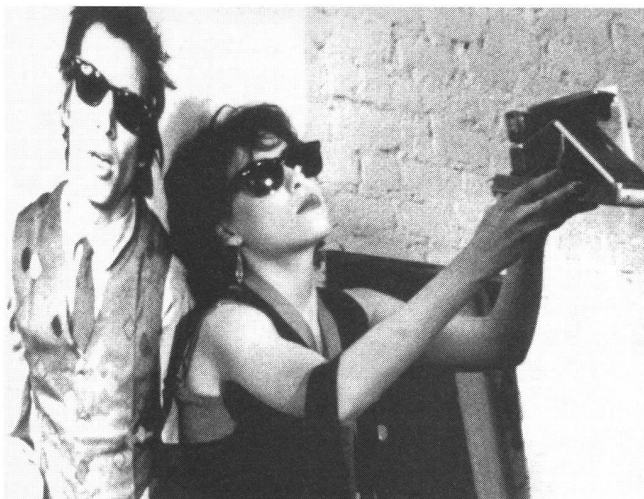
«Smithereens» (1981) von Susan Seidelman: Entwicklung eines persönlichen Stils in einem In-dependant-Film.