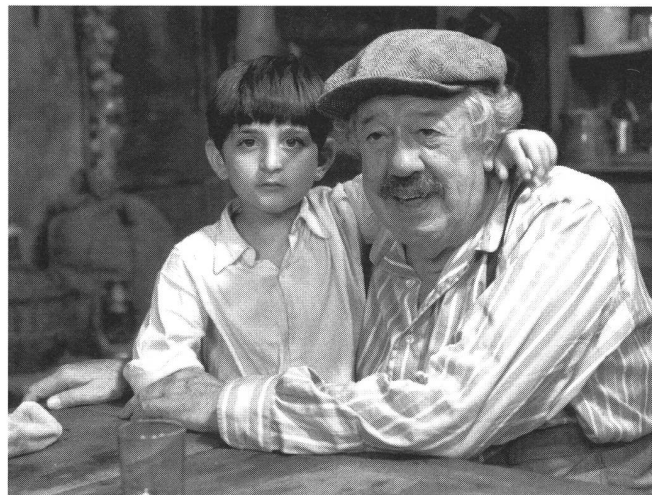
«Le vieil homme et l'enfant» (1966) von Claude Berri: entschlüsselung der Biografie