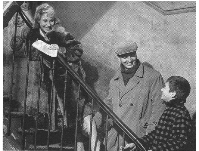
«Les quatre cent coups» (1959) von François Truffaut: vollendete Ausgangsposition für die Fortentwicklung von Stil, Methode und Thema

Das Problem des Debüts als Chance und Gefahr gibt es keineswegs nur im Bereich des ambitionierten Autorenfilms. Auch auf dem Gebiet des Genrefilmes gibt es Regisseure und Regisseurinnen, die mit dem allerersten Film ihr ganzes Können zeigen und an die Kraft des Erstlings später nur annähernd