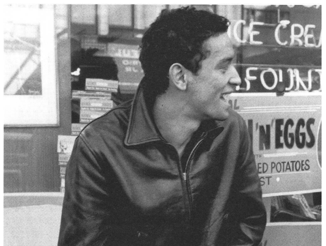
«Shadows» (1958) von John Cassavetes: radikale Einführung eines Stils