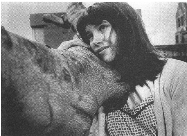
«David and Lisa» (1962) von Frank Perry: erweckte grosse Erwartungen.