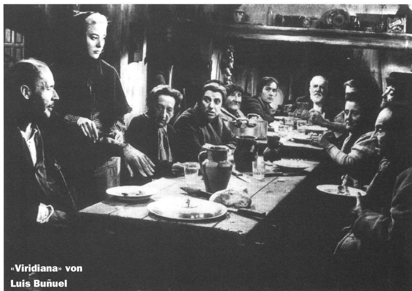
« Viridiana » von Luis Buñuel

Seinen sagenhaften Erstling « Un chien andalou » hat er schon seit etwas über dreissig Jahren hinter sich, als Luis Buñuel 1961 just im Lande und unter der wachsamen Zensur des Caudillos und Hitlerschen Konsorten Francisco Franco Bahamonde « Viridiana » dreht. Der berühmte spanische Surrealist ist bereits der Autor von um die zwanzig weiteren