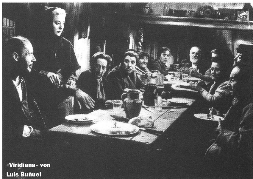
« Viridiana » von Luis Buñuel

Seinen sagenhaften Erstling « Un chien andalou » hat er schon seit etwas über dreissig Jahren hinter sich, als Luis Buñuel 1961 just im Lande und unter der wachsamen Zensur des Caudillos und Hitlerschen Konsorten Francisco Franco Bahamonde « Viridiana » dreht. Der berühmte spanische Surrealist ist bereits der Autor von um die zwanzig weiteren