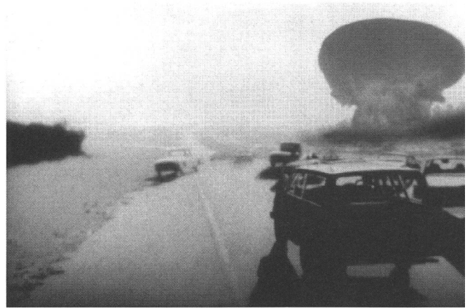
Unvollständiger Weltuntergang: « The Day After » von Nicholas Meyer

So hat das Ende von allem eben tatsächlich (wie der