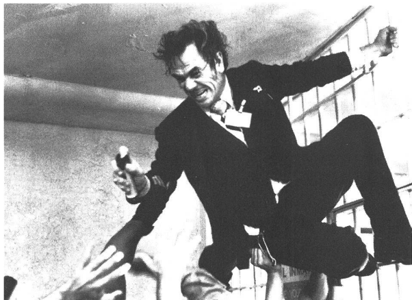
Alpträume der Verworfenheit: «Natural Born Killers» (1994) von Oliver Stone, ...

Dole hat sich sein Leben lang nicht übermässig für Film und Fernsehen, und schon gar nicht für Rap-Musik interessiert. Sie kommen ihm jedoch gelegen, weil er mit ihnen in ein Wespennest stechen und damit einer Industrie eins auswischen kann, die traditionsgemäss