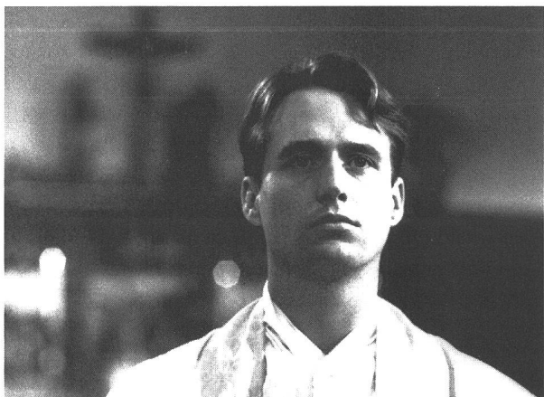
«The Priest» (1994) von Antonia Bird, ...