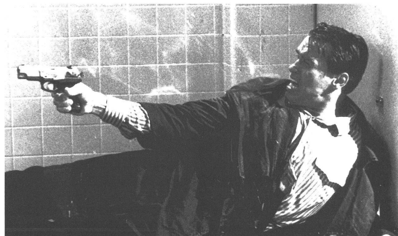
Politisch «korrekter» Familienfilm: «True Lies» (1994) von James Cameron

Politiker wie Bob Dole machen es sich nicht nur zu einfach, sie nehmen es auch mit der Wahrheit wenig genau. In einem Atemzug mit der Verteufelung von «True Romance» erklärt Dole Arnold Schwarzeneggers gewalttätigen und