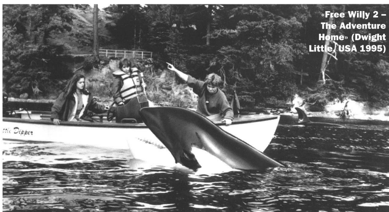
«Free Willy 2 – The Adventure Home» (Dwight Little, USA 1995)

Es ist ein charakteristisches Zeichen der Zeit, dass einst hoch angesehene Berufe heute Zielscheiben extremen Zorns sind. Ärzte, Anwälte und Politiker stehen tief