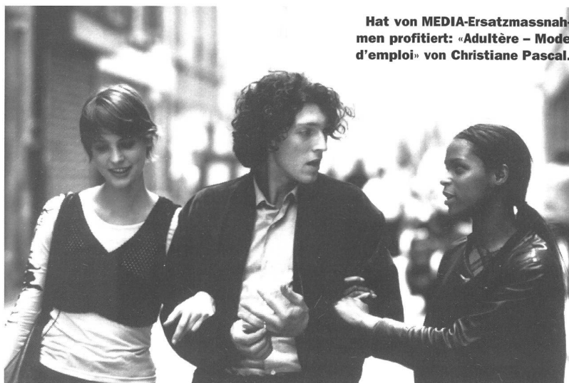
Hat von MEDIA-Ersatzmassnahmen profitiert: «Adultère – Mode d'emploi» von Christiane Pascal.

Fördern will MEDIA 2 die kontinuierliche Zusammenarbeit jener europäischen Verleiher, die gemeinsame Strategien für den europäischen Markt entwickeln. Und über die Entwicklungsförderung sollen Produzenten unterstützt werden, die gleich ein Paket von Filmen herstellen wollen. Doch wie haben die Filme auszusehen, die davon profitieren dürfen? In MEDIA-Kreisen spricht man von Grossproduktionen mit bekannten Stars und einem sogenannt international