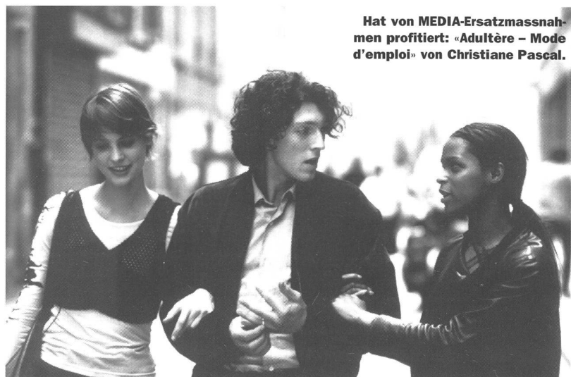
Hat von MEDIA-Ersatzmassnahmen profitiert: «Adultère – Mode d'emploi» von Christiane Pascal.

Fördern will MEDIA 2 die kontinuierliche Zusammenarbeit jener europäischen Verleiher, die gemeinsame Strategien für den europäischen Markt entwickeln. Und über die Entwicklungsförderung sollen Produzenten unterstützt werden, die gleich ein Paket von Filmen herstellen wollen. Doch wie haben die Filme auszusehen, die davon profitieren dürfen? In MEDIA-Kreisen spricht man von Grossproduktionen mit bekannten Stars und einem sogenannt international