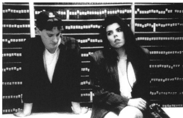
« Clerks » von Kevin Smith