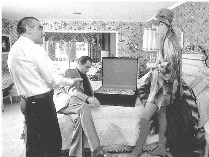
Dreharbeiten zu «Casino»

Scorsese hat es in «Casino», in dem auch Klänge aus