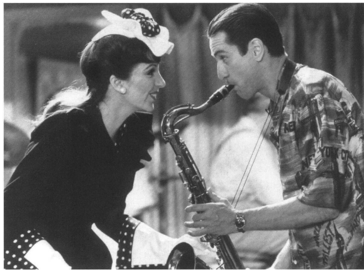
«New York, New York»: Story aus dem Milieu des Jazz

auf digitale Bänder also, überspielt. Sie enthalten Musik, die seit den fünfziger Jahren entstanden ist, und ich nehme sie praktisch überallhin mit. Ich höre Musik wenn ich einen Film vorbereite, bei den Dreharbeiten und in der Phase der Post-Produktion». Musik als Stimulans, als Inspiration, als Ideenquell für filmische Kreativität? Für Martin