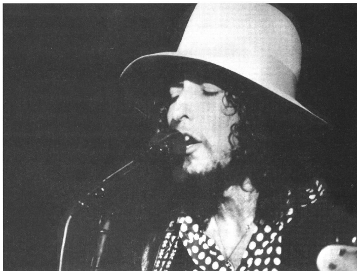
«The Last Waltz»: respektvolle Rock-Dokumentation

Ein Scorsese-Film ohne Musik als treibende Kraft, als swingendes, kommentierendes, assoziatives Erzähl- und Gefühlsmoment, scheint undenkbar. Die erwähnten Beispiele machen deutlich, welches Gewicht der amerikanische Filmartist der Musik-Ebene beimisst. Die Wurzeln dieser Passion gründen tief, wie ein Auszug aus seinem Vorwort zum