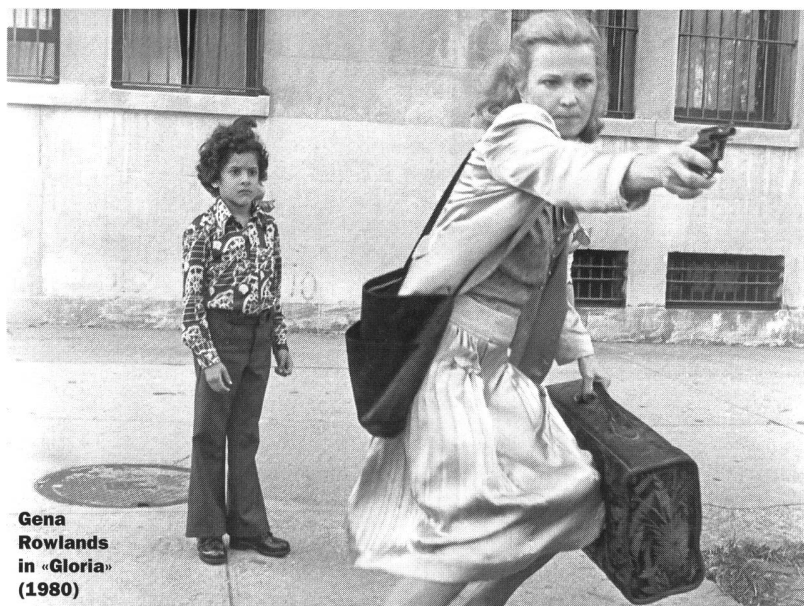
Gena Rowlands in «Gloria» (1980)

Als Autor hat er auch einen eigentlichen Genrefilm wie «Gloria» nicht als Genrefilm abgedreht, sondern die Regeln gebrochen, variiert und damit bereichert. In «Gloria» rächt sich die Mafia an einem Buchhalter und seiner Familie, weil dieser mit dem FBI zusammengearbeitet hat. Zu Beginn des Films kommt ein Mörderkommando und bringt die Familie um. Die Wohnungsnachbarin Gloria, gespielt von Gena Rowlands, hat sich kurz vorher bereit erklärt, den sechsjährigen Phil bei sich aufzunehmen und damit zu retten. Von der Mafia gejagt,