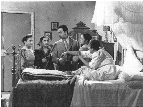
«Nisa bila rijal» (Frauen ohne Männer)