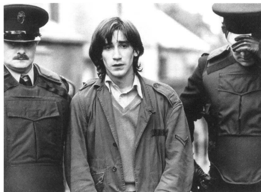
«Cal» (1984) von Pat O'Connor

Dramen mit universellem Charakter, die überall auf der Welt spielen können – in Belfast, Beirut oder South Central – wo Herrschende durch Unterdrückung an der Macht bleiben wollen. Dieser eindeutige Standpunkt bildet die grosse Stärke aber auch die Schwäche des Tandems George/Sheridan. Gerade die politische Situation der Zersplitterung in Nordirland – etwa die Divergenzen zwischen Sinn Fein und der IRA in der Frage des Gewaltverzichts, die unübersichtliche Lage im Lager der Unionisten, die widersprüchlichen politischen Signale aus Dublin und London – zeigt, dass Stellungnahme nicht einfach durch emotionale Betroffenheit ersetzt werden kann. Die Situation ist sehr viel schwieriger und komplexer als die Parteilichkeit der beiden Regisseure vermuten lässt. Trotzdem sind die beiden Filme wichtige Zeichen der Solidarität für die Sorgen, die Ängste und die Verzweiflung der nordirischen Bevölkerung.