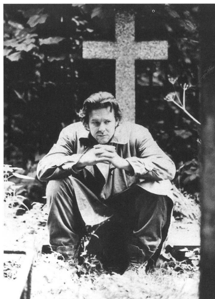
« A Prayer for the Dying » (1987) von Mike Hodges

und die politische Überzeugung des Terroristen verloren hat. Durch den tragischen Tod von Schulkindern bei einem Attentat der IRA wird Fallon aufgeschreckt. Genug ist genug. Jetzt will er mit dem Töten aufhören. Er setzt sich deshalb nach London ab und lässt sich in eine Sehnsucht nach dem Tode treiben. Hodges inszeniert diesen Thriller eigenwillig als vielschichtiges Geschehen. Allerdings geht es ihm nicht um die Ausleuchtung des historischen, religiösen oder politischen Hintergrundes des Konflikts. Er konzentriert sich ganz auf die Figuren, ihr Innenleben und die Verstrickungen, durch die sie in den Teufelskreis der Gewalt und des