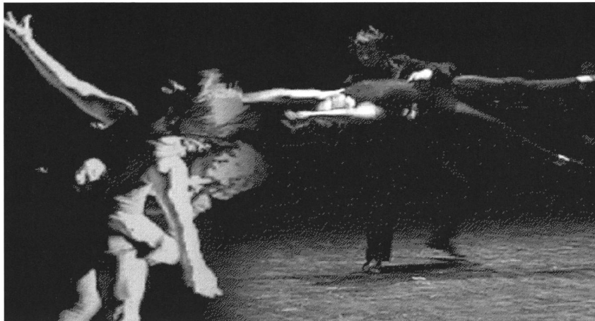
Bühnenboden als unsicherer Ort: «2», Stück der kanadischen Company LaLaLa Human Steps

sich die Nutzung der Bewegung als Organisationsprinzip der Montage. An der Nahtstelle der Schnitte warten unvollendete Bewegungsreste aus einer Handlung auf die Fortsetzung in der nächsten Einstellung. Das Publikum soll im Strom der Ereignisse nicht durch die Montage abgelenkt werden.