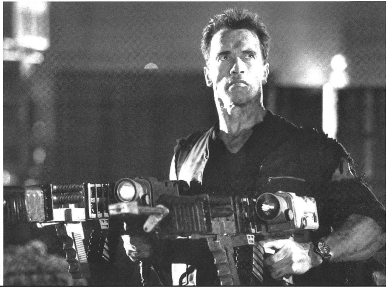
Dank spektakulären Versatzstücken zu universeller Akzeptanz: «Eraser» (1996) von Charles Russell

Range eines «Jurassic Park», «Forrest Gump» oder «Independence Day» in der Lage, ein Studio zu sanieren und die Aktien der Muttergesellschaft nach oben zu treiben. Dieser Fata Morgana laufen sie alle hinterher, sich gegenseitig ausstechend, Karrieren aufs Spiel setzend, im geeigneten Augenblick Ruhm reklamierend, selbst dann noch, wenn er ihnen gar nicht zusteht. Jon Peters und Peter Guber hatten sich bei den Dreharbeiten zu «Rain Man» nur ein einziges Mal sehen lassen; die Arbeit tat Barry Levinsons Kompagnon Mark Johnson. Doch als der Film mehrere Oscars erhielt, scheuten sie nicht davor zurück, sich von einem der Autoren die Statuette auszuleihen und sich damit fotografieren zu lassen.