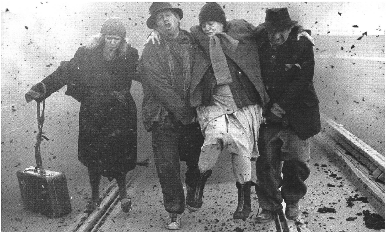
Ausweg aus dem Mangel an Geldern: «Szeressük egymást gyerekek» (Liebet einander, 1995) von Pál Sándor, Károly Makk und Miklós Jancsó (Episode von Pál Sándor)

ausbrachen und mit Ansätzen eigenverantwortlicher Studioarbeit experimentierten. Sie lernten also früher als andere «Block»-Kollegen die Licht- und Schattenseiten des Neuen kennen. Wohl auch deshalb ging man dort ein wenig behutsamer mit dem Abbau staatlicher Filmförderung um. Und wohl auch deshalb waren es auch gerade Ungarn, die auf internationalen Festivals und Konferenzen gleich nach der Wende nachhaltig für eine mitteleuropäische Kooperation warben.