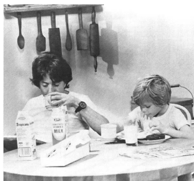
Dustin Hoffman als Vater in «Kramer vs. Kramer» (Robert Benton, USA 1979)

Mütter und Väter im Film: ZOOM geht der Frage nach, ob und wie sich gesellschaftliche Veränderungen im Elternbild im Kino niederschlagen. Hatten Emanzipation und Feminismus einen Einfluss auf die Rolle von Müttern im Film? Hat die Diskussion um den «neuen Mann» Spuren hinterlassen hinsichtlich der Bilder von Vätern im Kino? Ein weiterer Beitrag beleuchtet das Filmangebot für den gemeinsamen Kinobesuch für Eltern und Kinder.