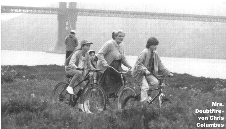
Mrs. Doubtfire» von Chris Columbus