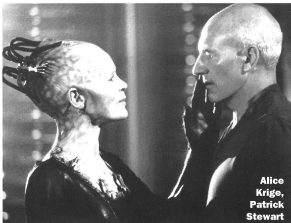
Alice Krige, Patrick Stewart

Für das Verständnis der Star-Trek-Welt, wie sie der ehemalige Bomberpilot Gene Roddenberry anfangs der sechziger Jahre geschaffen hat, ist Captain Picards (Patrick Stewart) Pendant, der Erfinder, bedeutsam. Dieser wird noch getrieben von Motiven unserer Gegenwart, von Gewinnsucht und Fleischeslust, ohne dass ihn dies aber diskreditiert: Er repräsentiert vielmehr die Geisteshaltung, die zu überwinden ist, um den multikulturellen Kosmos schaffen zu können, den die Föderation darstellt. Obwohl materielles Streben im 24. Jahrhundert keine Rolle mehr spielt, ist auch Picard nicht perfekt. Das zeigen seine Rachegefühle gegenüber den Borg, die Perfektion anstreben und dabei nur Grausamkeit säen. Aber man sollte nicht aufhören zu versuchen – so Picards und auch Roddenberrys Menschenbild –, immer besser zu werden. ■